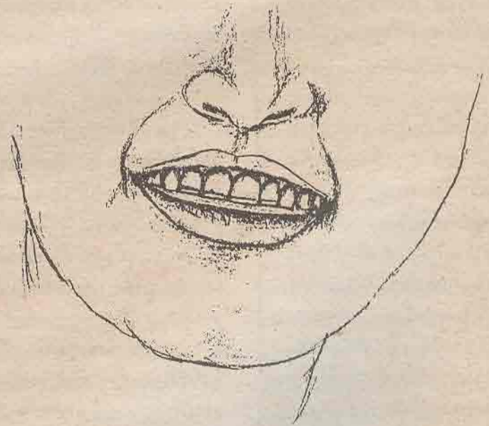
รูปที่ ๓ เป็นฟันตัดแต่งแบบธรรมดาในระยะหลัง ปลายฟันบนตั้งแต่เขี้ยวบนซ้ายจดเขี้ยวบนขวาจะตัดปลายจนเรียบเสมอกัน ผนังฟันตั้งแต่ปลายฟันจนถึงโคนฟันจะถูกขัดจนเรียบเพียงอย่างเดียว