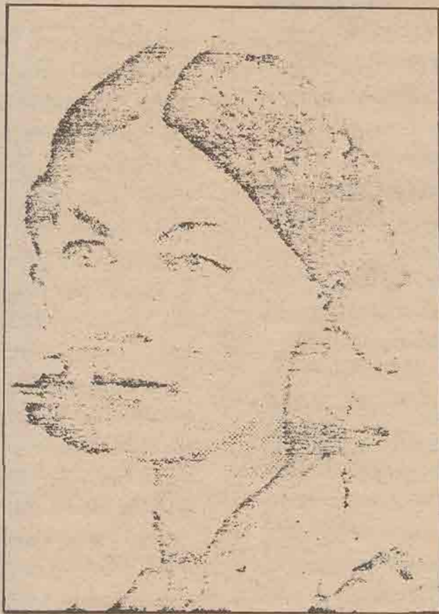
ฟลอเรนซ์ นิงเกด FLORENCE NIGHTINGALE