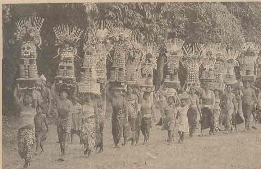
๘๖ รุสมินแล

พูดถึงคนแล้ว ควรพูดถึงขนบธรรมเนียม อาหารการกินควบคู่ไปด้วย