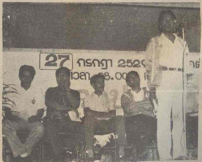
พรรคประชาธิปัตย์ ทาเสียงเลือกตั้ง พ็ยะลา