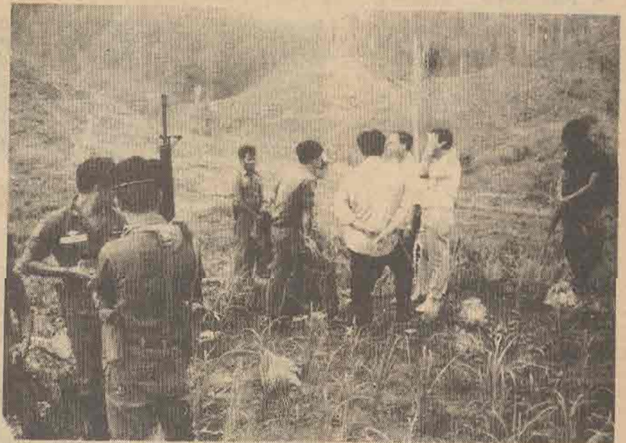
△ ไร่กล้วยชา สนค. เขต ๘ บุคเนาทำลายไร่กล้วยชาโทพาร ปลูกในพื้นที่ ๒๕๐ ไร่ ที่ อ.ละแม จ.ชุมพร สืบทราบว่ามีนายทุนใหญ่ และนักการเมืองหนุนหลัง