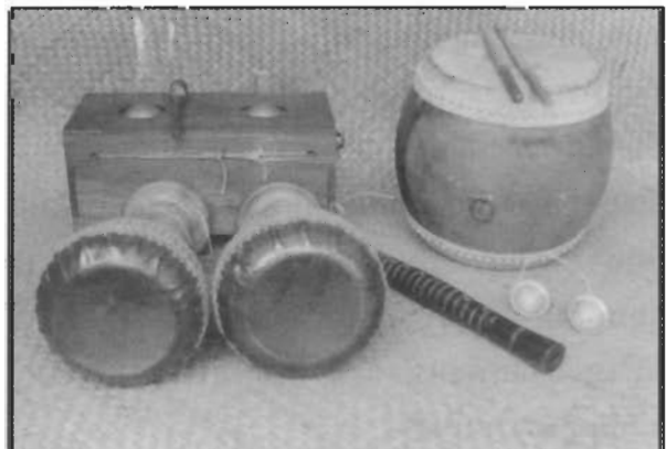
เครื่องดนตรี หนังตะลุง “เครื่องห้า” ทัพ โหม่ง กลองตุ๊ก ปี่ ฉิ่ง

ปัจจัยที่ 1 เกิดจากตัวนายหนังตะลุง กล่าวได้ว่าปัจจุบันสังคมยังมีความคาดหวังต่อหนังตะลุงว่าจะต้องสามารถทำหน้าที่ทั้งในด้านการให้ความบันเทิงคือ ให้ความสนุกสนานต่อผู้ชมหนังตะลุง และต้องเป็นผู้ทำหน้าที่ถ่ายทอดหรือให้ข้อมูล สารสนเทศต่อสังคมได้ เช่น การให้ความรู้เกี่ยวกับงานอาชีพ ความรู้ทางด้านกฎหมาย ความรู้เกี่ยวกับยาสมุนไพร การรักษาป้องกันโรค ฯลฯ นายหนังตะลุงจะต้องเป็นผู้ชี้แนะสังคมทั้งในด้านการครองตนตามหลักศาสนา และการมีวิจารณญาณในการเลือกสรรบุคคลที่จะต้องทำหน้าที่สำคัญในสังคม เช่น การเลือกกำนันผู้ใหญ่บ้าน รวมถึงการเลือกผู้แทนราษฎร เป็นต้น และ