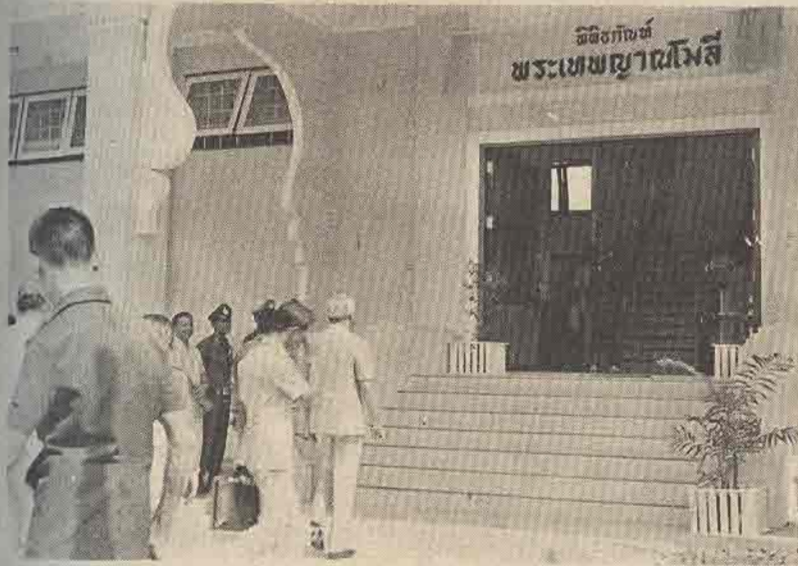
ฯพณฯ พลเอกเปรม ติณสูลานนท์ นายกรัฐมนตรีประธานในพิธีเปิด พิพิธภัณฑ์พระเทพญาณโมลี ณ มหาวิทยาลัยสงขลานครินทร์ วิทยาเขต บัตตานี เมื่อวันที่ ๕ เมษายน ๒๕๓๑

ต่าง ๆ ในจังหวัดสุราษฎร์ธานี เป็นจำนวนมาก ซึ่งการกระทำดังกล่าว นอกจากจะเป็นการแย่งอาชีพคนไทยบางอาชีพแล้ว ยังเป็นการฝ่าฝืน ไม่ปฏิบัติตามกฎหมาย ตาม พ.ร.บ. การทำงานของคนต่างด้าว พ.ศ. ๒๕๒๑ ได้กำหนดโทษสำหรับคนต่างด้าวผู้กระทำความผิดกรณีทำงานโดยไม่ได้รับอนุญาตหรือทำงานโดยฝ่าฝืนเงื่อนไข ตามที่กฎหมายกำหนด มีโทษจำคุกไม่เกิน ๓ เดือน หรือปรับไม่เกิน ๕,๐๐๐ บาท และบุคลิกหรือนิติบุคคลใดที่รับคนต่างด้าวเข้าทำงาน มีโทษจำคุกไม่เกิน ๓ ปี หรือปรับไม่เกิน ๖๐,๐๐๐ บาท หรือทั้งจำทั้งปรับ