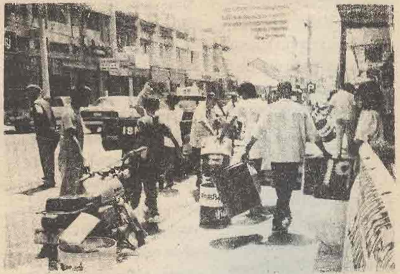
หาดใหญ่ สโมสรโรตารี คอหงส์ สงขลา ร่วมกับสโมสรโรตารีแอคท์ภาค ๓๓๕ พัฒนาทำความสะอาดและมอบถังขยะให้กับชาวอำเภอหาดใหญ่ จังหวัดสงขลา

ส่วนอุปกรณ์ตักกลั่นสุราเดือนที่จับกุมมาได้ทั้งหมดจะนำไปมอบแก่โรงเรียนที่ขาดแคลนอุปกรณ์เกี่ยวกับโครงการอาหารกลางวันทุกโรงเรียนเช่นกัน