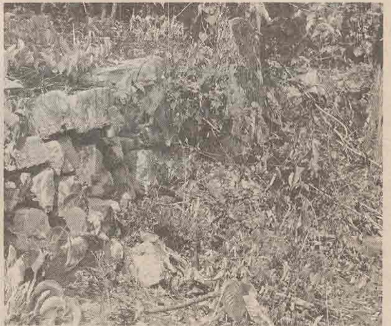
ภาพที่ ๓ แนวด้านกำแพงหิน ซึ่งอาจใช้เป็นฐานศาสนสถานบริเวณ ส่วนที่ ๔