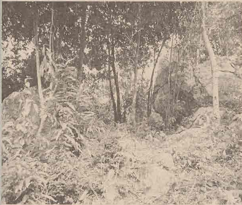
ภาพที่ ๔ สภาพบริเวณบนเนินดินด้านทิศเหนือสุด