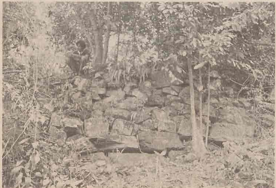
ภาพที่ ๑ กำแพงหินบริเวณมุมด้านทิศตะวันตก ของส่วนที่ ๒

แหล่งโบราณคดีเขาคา ตั้งอยู่ในเขตหมู่ที่ ๑๑ ต.เสาเกอ อ.สิชล จ.นครศรีธรรมราช หรือบริเวณรังที่ ๘๕๒ ๓๕" เหนือ และแวงที่ ๘๘° ๕๒ ๓๐" ตะวันออก (แผนที่ทหาร ลำดับชุด L๗๐๑๗ ระวัง ๔๘๒๖I, ๑-RTSD)