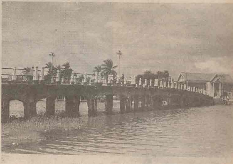
สะพานเดชาบุชิตครึ่งเป็นสะพานเดี่ยว