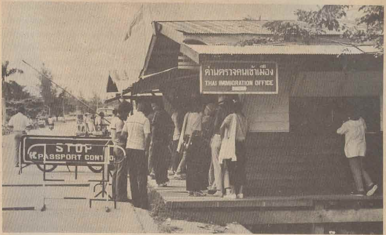
ด่านตรวจคน เข้า เมืองที่ฝั่งไทย

พวก โกดี้ก็ถูกลูกจอบัดหนังสือเดินทาง ไปดำเนินการให้สมมติว่าต้องเสียค่าธรรมเนียมที่ด่านคนละ 10 บาท พวก ผีก็จะตีเป็น 20-30 บาท แถมไม่ยอมกินหนังสือเดินทางจนกว่าจะดูเลือดให้อิมตามต้องการ