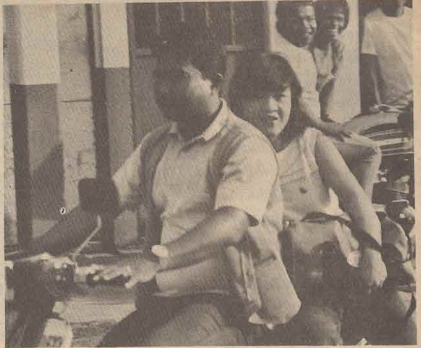
เข้าและ เย็น เราพบภาพ เช่นนี้ เสมอ