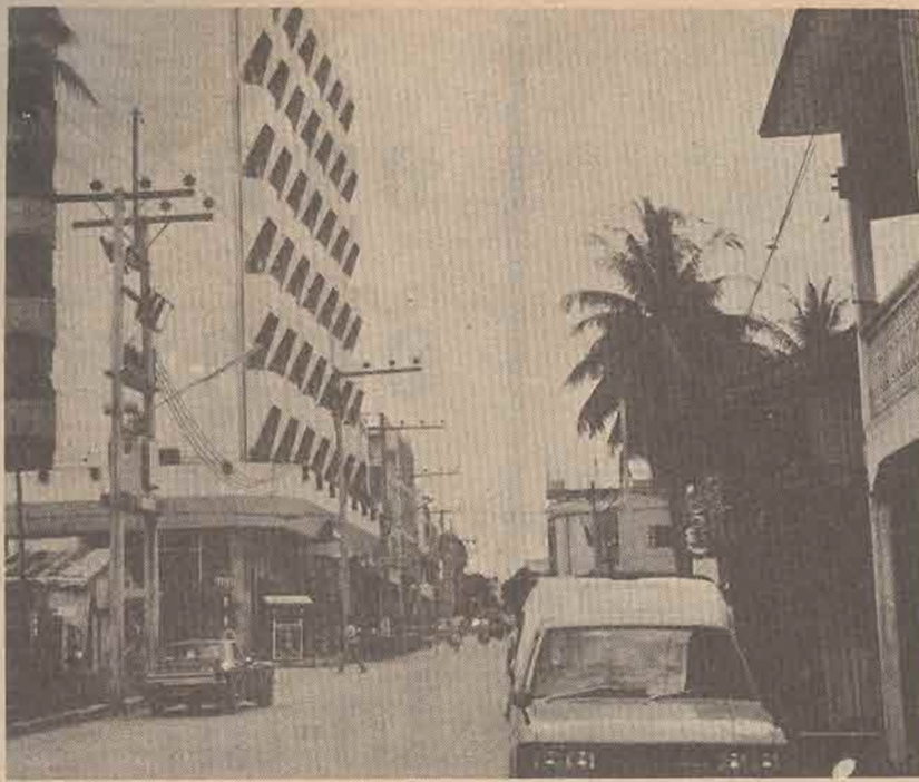
มุมหนึ่งในตลาดสุโข-ลก

จากนั้นสี่ปีต่อมา รัฐบาลได้เปิดเดินรถไฟถึงสถานีสุโข-ลก ที่ดินใกล้สถานีส่วนใหญ่คงเป็นป่าอยู่ดั้งเดิม แต่ฝั่งตรงกันข้ามคือรันดุนยังมีชาวบ้านอาศัยอยู่หนาแน่น ชาวตำบลปุโยะฝั่งไทยมีสินค้าจะซื้อขายแลกเปลี่ยน หรือจะซื้อเครื่องอุปโภคและบริโภคต่าง ๆ ก็จำเป็นข้ามฝั่งไปที่สถานีรถไฟรันดุน-บันยัง การนำเอาสินค้าเข้าออกก็ต้องเสียภาษีทั้งสองฝ่าย คือทั้งฝ่ายสยามและฝ่ายก๊กกันตัน จึงไม่เป็นการสะดวกกับไทยเท่าที่ควร