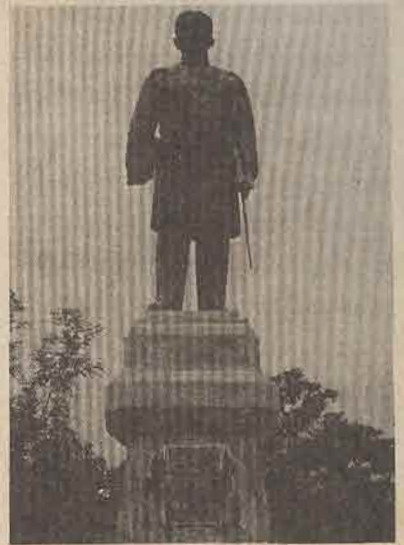
อนุสาวรีย์พระยารัษฎานุประดิษฐ์

ยังร่มรื่นและเขียวชอุ่มด้วยสวนยางพารา ซึ่งเป็นรุ่นหลานรุ่นเหลน ของพันธุ์พื้นเมืองเดิม ผมเห็นแผ่นยางสีขาวพาดอยู่บนราวไม้ไผ่หน้าบ้าน เหมือนกับผ้าอ้อมเด็กน้อยเวลานั้น