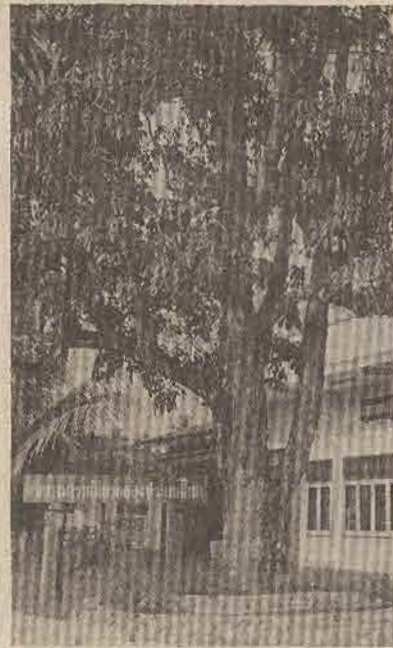
ต้นยางพาราต้นแรก

เราหยุดรถตรงริมถนนหน้าวัดศรีคงคภูมิ พุทธาวาส หรือหน้าสหกรณ์การเกษตรอำเภอกันตัง มีป้ายบอกไว้ว่า "ต้นยางพาราแห่งแรกของประเทศไทย" เพราะตรงนั้นมีต้นยางพาราต้นเดียวแผ่กิ่งก้านสาขาร่มรื่นโคนต้นมีฝ้าแดงโอบพันไว้ ด้วยความเชื่อของชาวบ้านหรือแสดงความฉลาดอย่างหนึ่งในการอนุรักษ์ของมีค่า ผมคำนวณว่าอายุยางพาราต้นนี้ไม่ต่ำกว่า ๘๕ ปี เพราะเริ่มปลูกยางพาราที่กันตังเมื่อ พ.ศ. ๒๔๕๔