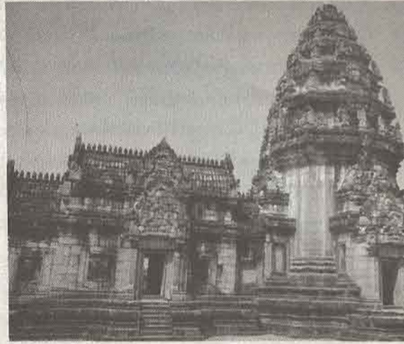
- ปราสาทหินพิมาย

เราเดินทางกันมาหลายวันหลายจังหวัดได้พบเห็นหลายสิ่งหลายอย่างซึ่งให้ทั้งความรู้ ความสวยงาม และความเบิกบานสนุกสนาน ตอนนี้อย่าจะเดินทางกลับซักอาลัยอวรณ์ไม่อยากจะกลับเหมือนกันคะ แต่ไม่เป็นไร หน้อยปลอบใจตนเองว่าปีหน้าฟ้าใหม่เราค่อยหาทางมา