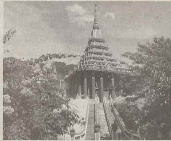
- พระพุทธรูปสระบุรี

อุทยานแห่งชาติเขาใหญ่ที่ใหญ่สมชื่อจริง ๆ คะคุณยาย มีอาณาบริเวณครอบคลุมถึง 4 จังหวัดนะคะ คือจังหวัดนครราชสีมา นครนายก สระบุรี และปราจีนบุรี รวมพื้นที่แล้วมีมากถึง ๒,๑๖๘ ตารางกิโลเมตร เป็นสถานที่ท่องเที่ยวที่มีชื่อเสียงเป็นที่รู้จักของคนทั่วไป เพราะในเขตของอุทยานฯ มีน้ำตกที่สวยงามหลายแห่ง เช่น น้ำตกเหวสุวัต น้ำตกผากล้วยไม้ เป็นต้น นอกจากนี้ยังมีสัตว์ป่าชุกชุมอีกด้วย สัตว์บางชนิดไม่สามารถหาดูได้จากแห่งอื่นอีกแล้วในประเทศไทย