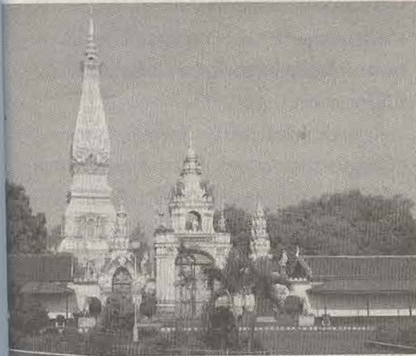
พระธาตุพนม

เมืองดอกบัว เราได้แวะวัดหนองบัวเพื่อนมัสการองค์เจดีย์ ที่จำลองแบบมาจากพระเจดีย์พุทธคยา ซึ่งเป็นสถานที่ตรัสรู้ของพระพุทธองค์ เป็นวัดเดียวในประเทศไทยที่มีเจดีย์แบบนี้ องค์เจดีย์เป็นสีขาวใหญ่โตมาก ที่ฐานล่างเป็นรูปสี่เหลี่ยมจัตุรัส ส่วนที่สูงขึ้นไปจะค่อยๆ สอดเข้า แล้วต่อยอดด้วยสถาปัตยกรรมอีกชั้นหนึ่ง แต่ละด้านขององค์เจดีย์มีลวดลายหล่อด้วยปูนทาสีทองประดับ มีพระพุทธรูปหลายองค์ประดิษฐานอยู่ภายในองค์เจดีย์ซึ่งพุทธศาสนิกชนสามารถเข้าไปกราบนมัสการได้ด้วย