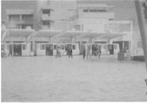
จุดจอร์บส่งผู้โดยสารรถไฟฟ้าของพิพิธภัณฑ์และหอศิลป์ The J. Paul Getty และลานโล่งก่อนเข้าชมในอาคาร

เมื่อลงจากรถไฟฟ้าเข้าสู่บริเวณลานกว้างหน้าอาคารพิพิธภัณฑ์ จะพบงานประติมากรรมขนาดใหญ่ตั้งสูงตระหง่าน โดดเด่นกลมกลืนไปกับสภาพแวดล้อมของตัวอาคาร และตรงลานกลางแจ้งจะมีสิ่งพิมพ์ แผ่นพับต่างๆ เป็นแนวนำทาง แนะนำสถานที่และจุดต่างๆ ที่มีการแสดงงานศิลปกรรม เอกสารดังกล่าวได้ถูกแปลไว้หลายภาษาด้วยกันเพื่อแจกให้กับผู้เข้าชมพิพิธภัณฑ์ สำหรับบริเวณจุดชมทัศนียภาพนอกอาคารจะมีร่มไม้สักล่องไว้อย่างเป็นระเบียบสำหรับบริการเมื่อยามแดดจ้าหรือฝนตก เป็นสิ่งที่น่าประทับใจยิ่ง