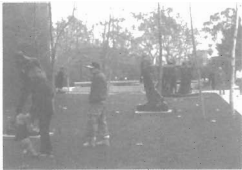
การพักผ่อนของครอบครัวในพิพิธภัณฑ์ Norton Simon Museum เป็นภาพที่พบเห็นจนชินตา

ประติมากรรมจัดวางอยู่อย่างเหมาะสม (เห็นได้ถึง การวางแผนในการออกแบบและการกำหนดพื้นที่ ใช้สอย) มีการปรับยกระดับพื้นให้สูงขึ้นและติดตั้ง ผลงานประติมากรรมไว้ตามจุดต่างๆ ทักษะนิยภาพ ของต้นไม้ที่ปลูกไว้เหมาะสมกับตัวผนังของอาคาร และรูปลักษณะของสถาปัตยกรรมกลมกลืนและเน้น ให้ผลงานประติมากรรมดูเด่นสวยงามขึ้น