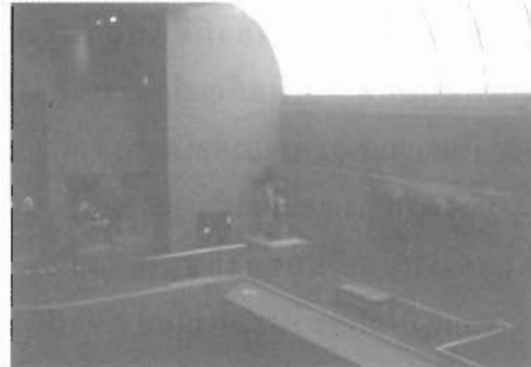
การจัดแสดงภาพเขียนภายในพิพิธภัณฑ์และหอศิลป์

การจัดแบ่งและออกแบบห้องแสดงนิทรรศการ ประกอบด้วย