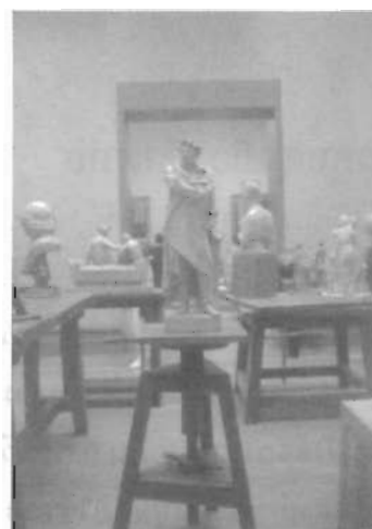
กลุ่มประติมากรรมที่จัดแสดงภายในพิพิธภัณฑ์และหอศิลป์ J.Paul Getty Art Museum

พันธะสัญญาที่ผมมีกับท่านผู้อ่านไว้ว่าจะ นำเสนอในเรื่องพิพิธภัณฑ์ทั้งสามแห่งดังกล่าว ก็ผ่านไปเท่าที่ผมพอจะเก็บข้อมูลกลับมาขังรูสมิแล บ้านเกิดได้... ฉบับนี้มุมศิลปะคงต้องลาไปก่อน พร้อมกับเรื่องราวการเดินทางชมศิลปกรรมอันยาวเหยียดหลายหน้ากระดาษของผม ด้วยหวังว่าคงมี ประโยชน์แก่ท่านผู้อ่านตามสมควร พบกันใหม่ใน ฉบับหน้าเป็นตอนสุดท้ายเก็บตกเรื่องราวต่างๆ ใน เมือง L.A. คู่ชาวรูสมิแลได้อ่านกันครับ... โปรด ติดตาม