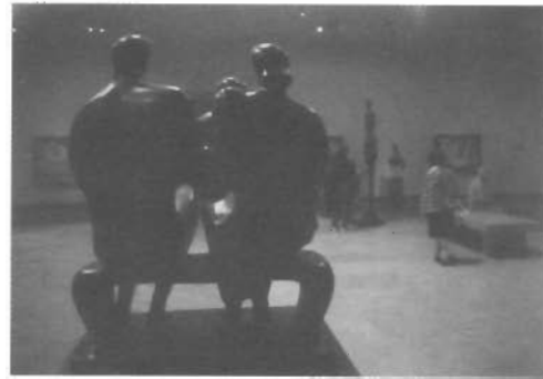
ผลงานประติมากรรมซึ่งจัดแสดงภายในอาคารพิพิธภัณฑ์และหอศิลป์ Norton Semon Museum

- ชั้นล่าง (ชั้นใต้ดิน) สำหรับจัดแสดงนิทรรศการถาวร และนิทรรศการหมุนเวียน ประกอบด้วย ห้องแสดงศิลปกรรมของ South Asian เป็นนิทรรศการประจำ และห้อง Special Exhibitions จัดแสดงนิทรรศการแบบหมุนเวียนสลับสับเปลี่ยนไป