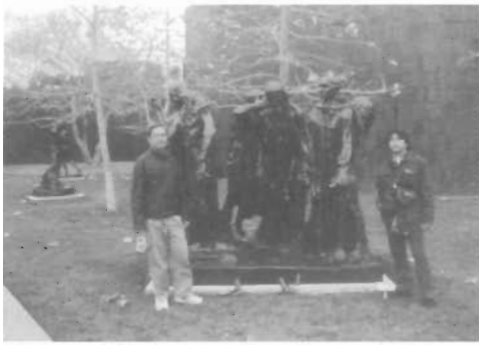
ส่วนประติมากรรมของพิพิธภัณฑ์และหอศิลป์ Norton Semon Museum

มุมมองศิลปะในฉบับนี้ยังมีอีกสถานที่หนึ่งที่สำคัญนำเสนอคือ พิพิธภัณฑ์และหอศิลป์ของเอกชนที่เก็บสะสมผลงานของศิลปินคนสำคัญ ๆ ของโลกไว้ ทั้งจิตรกรรมและประติมากรรม โดยเฉพาะประติมากรรมชิ้นเยี่ยมของอินเดีย เขมร และ ศิลปกรรมแถบโลกตะวันออกไว้อย่างครบถ้วนน่าใจหาย