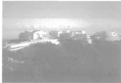
กลุ่มอาคารพิพิธภัณฑฯและหอศิลป์ J.Paul Getty

ทศนาญชลีได้ติดต่อกับเจ้าหน้าที่ของพิพิธภัณฑฯ และหอศิลป์ J. Paul Getty ไว้ในตอนบ่ายของวัน เพื่อเข้าชมระบบจัดเก็บข้อมูลและการเตรียมแสดงผลงานต่างๆ ว่ามีขั้นตอนและกระบวนการสำคัญอย่างไร