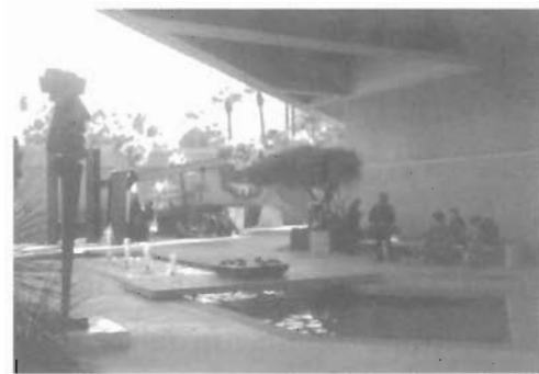
ลานประติมากรรมของพีพิธภัณฑ์และหอศิลป์ Palm Spring Desert Museum

Palm Spring Desert Museum ตั้งอยู่ที่ 101 Museum Drive Palm Spring, California 92266 พีพิธภัณฑ์แห่งนี้ออกแบบตัวอาคารและประดับตกแต่งด้วยวัสดุที่มีความสัมพันธ์กลมกลืนกับธรรมชาติ และสภาพแวดล้อมภายนอก เป็นอาคารสูง 2 ชั้น ประกอบด้วยตัวอาคาร 2 หลังคือ