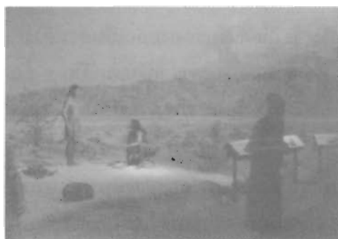
กิจกรรมของชาวเผ่าพื้นเมือง (ภาพจำลองจากหุ่น) และภาพเขียนแบบ Panorama

สิ่งที่ผมสนใจและชื่นชมพิเศษคือ Plam Spring เป็นหอศิลป์วัฒนธรรมที่อยู่ในแถบชานเมือง ตั้งอยู่ ณ สถานที่ที่มีฐานทางวัฒนธรรมพื้นเมือง มีเอกลักษณ์ทางวัฒนธรรมที่ชัดเจน (คล้ายกับภาคใต้บ้านเรา) มีการแสดงเป็นภาพ Panorama แสดงให้เห็นภาพวิถีชีวิตของชนพื้นเมือง ชีวิตสัตว์ทะเลทราย ระบบนิเวศน์และห้วงโซ่อาหารตามธรรมชาติ จัดแสดงไว้อย่างน่าสนใจ เป็นฐานความเข้าใจของคนพื้นเมืองก่อนที่จะก้าวเข้าสู่ยุคเทคโนโลยีอุตสาหกรรม และสารสนเทศในปัจจุบัน การจัดเก็บผลงานและนำเสนอเป็นไปอย่างมีระบบ จึงมีความครบถ้วนและลงตัวทั้งทางวัฒนธรรมและศิลปกรรมสมัยใหม่ เหมาะที่จะเป็นตัวอย่างให้แก่พิพิธภัณฑ์และหอศิลป์วัฒนธรรมภาคใต้เป็นอย่างยิ่ง