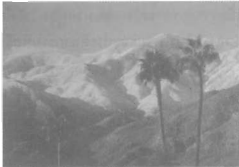
บรรยากาศของทิวทัศน์เมือง Palm Spring