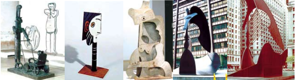
ภาพประกอบที่ 13 ประติมากรรม ของ Pablo Picasso