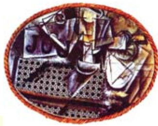
ภาพประกอบที่ 9 จิตรกรรมที่มีการใช้วัสดุปะติดผลงานของ Pablo Picasso .

ภาพผลงานที่ 9 ภาพผลงานของศิลปิน Pablo Picasso มีการใช้วัสดุผสมผสานปะติดลงไป ในผลงานจิตรกรรม เป็นอีกหนึ่งรูปแบบและเป็นการสร้างมิติใหม่ต่อกระบวนการสร้างงานจิตรกรรมสมัยใหม่อันส่งผลให้ศิลปินในยุคสมัยต่อมาได้ใช้คิดคลี่คลายรูปแบบและวัสดุในการสร้างผลงานอย่างหลากหลายส่วน ในภาพผลงานที่ 55 จิตรกรรมของ Pablo Picasso แสดงผลงานที่มีคูสีและค่าน้ำหนักขาว-ดำ ตัดกันอย่างเข้มข้น