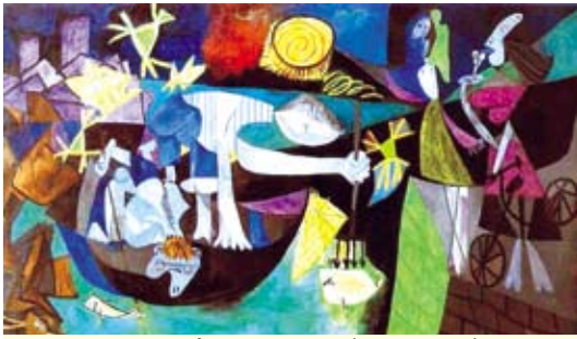
ภาพประกอบที่ 10 จิตรกรรมที่มีการใช้ลู่สีที่เข้มข้น ในผลงานของ Pablo Picasso.