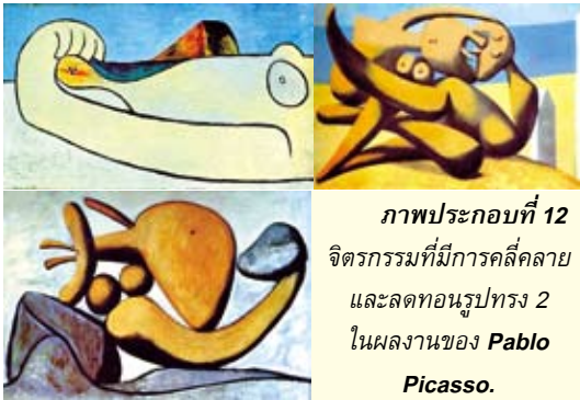
ภาพประกอบที่ 12 จิตรกรรมที่มีการคลี่คลาย และลดทอนรูปทรง 2 ในผลงานของ Pablo Picasso.