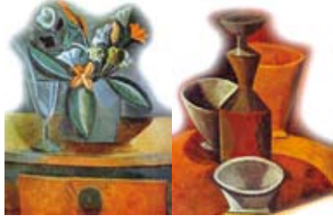
ภาพประกอบที่ 7 จิตรกรรมภาพหุ่นนิ่ง ผลงานของ Pablo Picasso .

ภาพประกอบที่ 7 รูปทรงของหุ่นนิ่งที่เป็นเหลี่ยมเป็นมุมนี้ ได้กลายเป็นรูปแบบสำคัญซึ่งส่งผลต่อพัฒนาการในโลกของศิลปะ ผลงานของศิลปิน Pablo Picasso แสดงคุณลักษณะเฉพาะตัวผ่านจิตรกรรมหุ่นนิ่ง ผลงานแต่ละชิ้นสะท้อนการวิเคราะห์ที่เจาะลึกเข้าไปสู่การวิเคราะห์รูปทรงของหุ่นนิ่งชนิดต่างๆ ผ่านกระบวนการสร้างสรรค์ของศิลปิน