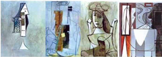
ภาพประกอบที่ 11 จิตรกรรมที่มีการคลี่คลายและลดทอนรูปทรง 1 ในผลงานของ Pablo Picasso.

ภาพที่ 11,12 แสดงการคลี่คลายลดทอนรูปทรง จนสิ่งที่ปรากฏเป็นสัญลักษณ์บางอย่างตามเจตนา ของศิลปิน