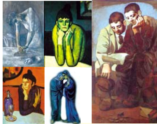
ภาพประกอบที่ 6 จิตรกรรมภาพคนผลงานของ Pablo Picasso.

ภาพที่ 5 แสดงภาพศิลปินซึ่งเป็นบุคคลที่ยิ่ง