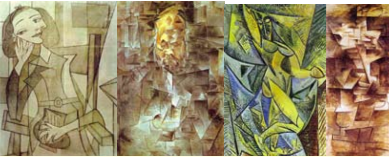
ภาพประกอบที่ 8 วิเคราะห์จิตรกรรมภาพคนผลงานของ Pablo Picasso .

ภาพผลงานที่ 9 ภาพผลงานของศิลปิน Pablo Picasso มีการใช้วัสดุผสมผสานปะติดลงไป ในผลงานจิตรกรรม เป็นอีกหนึ่งรูปแบบและเป็นการสร้างมิติใหม่ต่อกระบวนการสร้างงานจิตรกรรมสมัยใหม่อันส่งผลให้ศิลปินในยุคสมัยต่อมาได้ใช้คิดคลี่คลายรูปแบบและวัสดุในการสร้างผลงานอย่างหลากหลายส่วน ในภาพผลงานที่ 55 จิตรกรรมของ Pablo Picasso แสดงผลงานที่มีคูสีและค่าน้ำหนักขาว-ดำ ตัดกันอย่างเข้มข้น