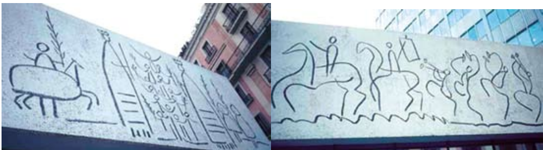
ภาพประกอบที่ 14 Pablo Picasso. แสดงตัวอย่างภาพผลงานของ Pablo Picasso ติดตั้งในสถานที่สาธารณะ