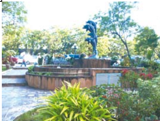
ลานประติมากรรมปลาโลมา เป็นที่พักผ่อนหย่อนใจผู้มาเยี่ยมชม