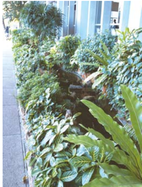
สวนน้ำและสวนหย่อมหน้าอาคารโรงพยาบาลฯ

ข้ามถนนมาด้านอาคารโรงพยาบาลซึ่งมีความกว้างของด้านหน้าอาคารยาวประมาณ 150 เมตร ผมโชคดีที่ยังจำสภาพของด้านหน้าของอาคารนี้ได้ เพราะไม่มีสิ่งที่น่าสนใจอะไรเลย! แต่หลายปีมานี้ได้มีการปรับปรุงทัศนียภาพด้านหน้าอาคารซึ่งเปรียบเสมือนหน้าตาของโรงพยาบาลฯ มีการจัดสวนหย่อมและสวนน้ำสลับกัน สวนน้ำก่อคอนกรีตเป็นลำธารน้ำเล็กๆ ใส่น้ำเพื่อเลี้ยงปลาครีฟสีส้มสวยงาม ที่ขอบลำธารน้ำก็จะตกแต่งด้วยไม้ใบหลากหลายชนิดสร้างบรรยากาศคล้ายธรรมชาติจริงๆ บางส่วนของสวนน้ำจะจัดวางน้ำพุเป็นจุดเพื่อสร้างบรรยากาศของการเคลื่อนไหว ทำให้สวนที่ตกแต่งมีชีวิตชีวายิ่งขึ้น การตกแต่งด้านหน้าของอาคารโรงพยาบาลฯ นี้ได้ผลในด้านความงามสร้างบรรยากาศที่ร่มรื่นและไม่น่าเบื่อ