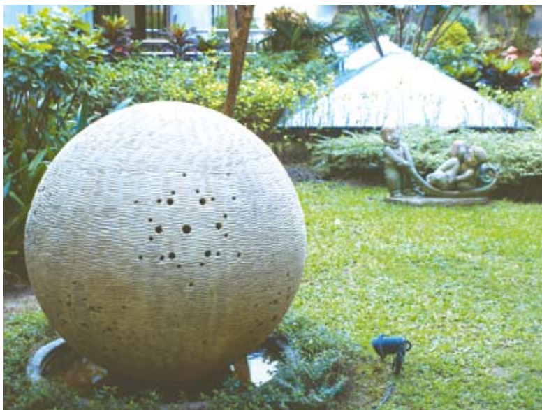
ประติมากรรมหินทรายทรงกลม