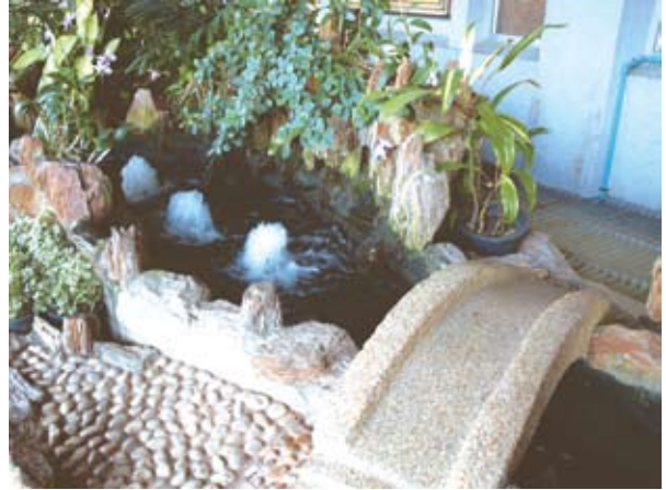
จัดน้ำพุในส่วนที่เป็นสวนน้ำแบบญี่ปุ่น