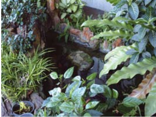
พันธุ์ไม้ส่วนมากเป็นไม้ใบหลากหลายชนิด สร้างความเป็นธรรมชาติ