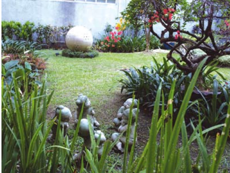
ประติมากรรมทรงกลมช่วยลดความแข็งกระด้างของอาคารได้