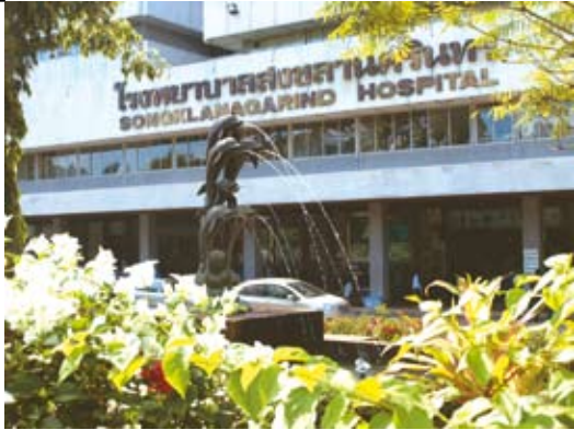
มุมมองหน้าโรงพยาบาลสงขลานครินทร์