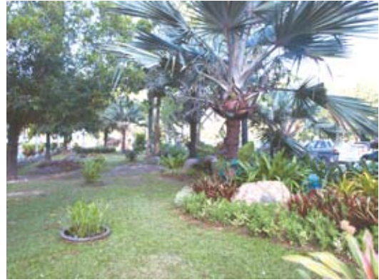
สวนหย่อมหน้าลานจอดรถ