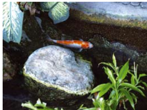
ปลาครีฟแหวกว่ายอยู่ในสวนน้ำหน้าโรงพยาบาลฯ