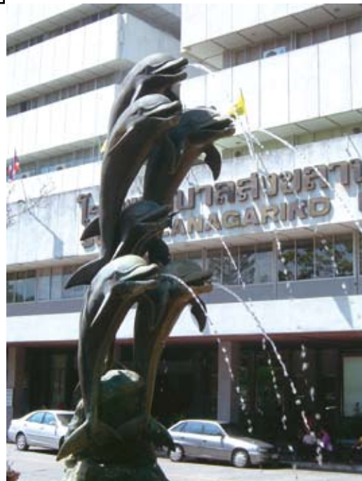
ประติมากรรมปลาโลมา หน้าลานจอดรถ

ข้ามถนนไปยังลานจอดรถที่อยู่ตรงข้ามกับอาคารใหญ่โรงพยาบาลสงขลานครินทร์ เราจะเดินผ่านลานประติมากรรม ที่สามารถทำให้เราหายใจเหนื่อยและสดชื่นขึ้นทันที ประติมากรรมชิ้นนี้เป็นประติมากรรมแบบลอยตัว มีลักษณะเหมือนจริงสามารถมองได้รอบด้าน เป็นประติมากรรมโลหะรูปปลาโลมาหกตัวต่อตัวขึ้นไปในแนวตั้งกำลังพ่นน้ำออกมาเป็นสายน้ำชุ่มฉ่ำตลอดเวลาไม่มีวันหยุดเหมือนการดำเนินไปของภารกิจการรักษาผู้เจ็บป่วยที่มีมาตลอดทุกวันไม่มีว่างเว้น นับวันกลับทวีจำนวนขึ้นอย่างมากมาย เหตุเพราะโรงพยาบาลสงขลานครินทร์ในปัจจุบันมีชื่อเสียงในการให้บริการทางการแพทย์ มีอุปกรณ์ที่ทันสมัย มีแพทย์และบุคลากรทางการแพทย์ที่มีความรู้ความสามารถในการรักษาผู้ป่วย เป็นที่เชื่อถือของคนทั่วไปในภาคใต้ที่ว่าง (Space) ระหว่างถนนหน้าโรงพยาบาลและลานจอดรถ โรงพยาบาลฯ จัดสวนหย่อมเพื่อเพิ่มความร่มรื่นและสวยงามด้วย