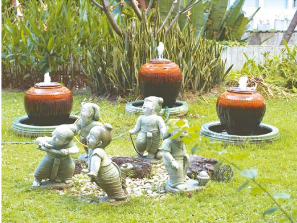
เด็กจุกเพิ่มบรรยากาศการเล่นสนุกสนาน

สวนสวยของโรงพยาบาลสงขลานครินทร์ ได้ผ่านสายตาของผู้คนมากมายทั้งผู้ที่เจ็บป่วย ผู้ที่มาเยี่ยมเยียนญาติมิตรที่โรงพยาบาลสงขลานครินทร์ แต่ละคนได้รับความประทับใจมากน้อยต่างกัน แต่โรงพยาบาลสงขลานครินทร์ก็จะมุ่งมั่นปรับปรุงทั้งการบริการทางด้านร่างกายเยียวยารักษาโรคผู้เจ็บป่วย พร้อมกับการให้ความสุขทางด้าน