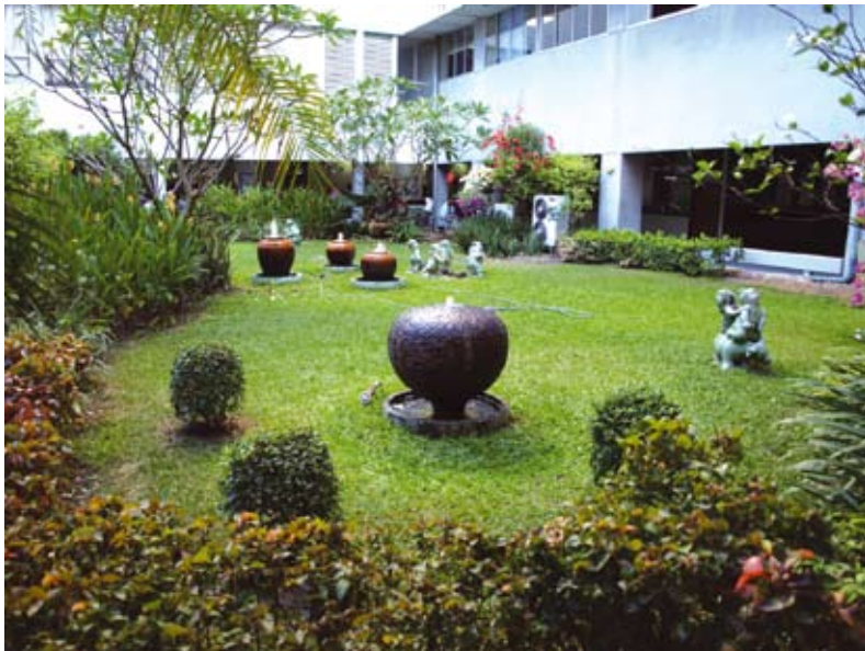
น้ำพุเครื่องปั้นดินเผาช่วยให้บรรยากาศ ของโรงพยาบาลเย็น สดชื่นขึ้น