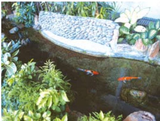
ธรรมชาติหน้าโรงพยาบาลฯ