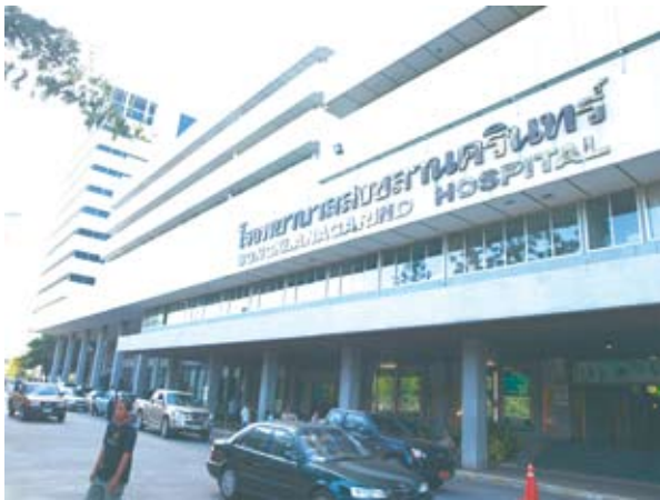
ด้านหน้าโรงพยาบาลสงขลานครินทร์

แนวทางของเอเชีย รับผิดชอบในด้านการแพทย์ การพยาบาลให้แก่ประชาชนในภาคใต้ เป็นที่เชิดหน้าชูตาของชาวใต้ทุกคนคือ “โรงพยาบาลสงขลานครินทร์” เที่ยวได้ จวบนี้ขอนำท่านมาเที่ยวโรงพยาบาลสงขลานครินทร์ แต่ไม่ได้มาโรงพยาบาลเพราะเหตุอาการเจ็บป่วยแต่ประการใด แต่อยากนำท่านมาชม “สวนสวยที่โรงพยาบาลสงขลานครินทร์”