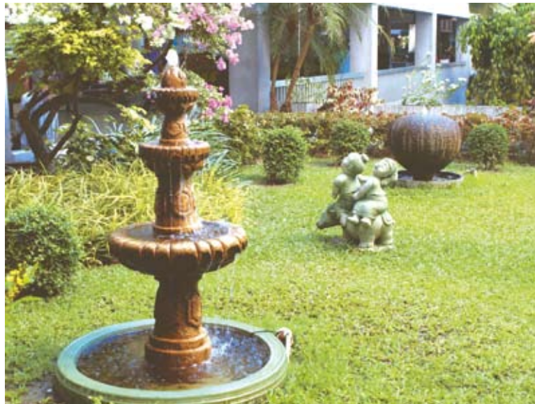
น้ำพุให้ความรู้สึกเจริญเติบโตและชื่นฉ่ำสดชื่น รู้สึกคลายร้อน

สองสนามนี้ตกแต่งอย่างเรียบง่ายด้วยไม้ใบเป็นพุ่ม หลากหลายชนิดและไม้ดอกของต้นเฟื่องฟ้าเพื่อเพิ่มสีสัน โดยใช้ประติมากรรมหินทรายของกลุ่มเด็กจุก รูป ทรงเรขาคณิต น้ำพุรูปทรงสูง 3 ชั้น น้ำพุจากรูป ทรงเครื่องปั้นดินเผา จัดวางเป็นจุดเพื่อให้พื้นที่ว่าง น่าสนใจยิ่งขึ้น