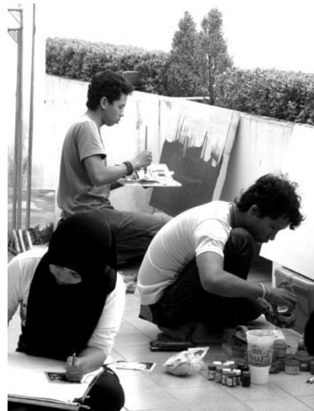
ภาพประกอบที่ 5-6 บรรยากาศในการปฏิบัติงาน

การสร้างสรรค์ผลงานทางด้านศิลปกรรมนั้น นับเป็นสื่อกลางในการถ่ายทอดสภาพแวดล้อม วิถีชีวิตของคนในชุมชน ตลอดจนถึงศิลปวัฒนธรรม โบราณสถาน ภูมิปัญญาท้องถิ่น และแหล่งท่องเที่ยว บริเวณลุ่มน้ำทะเลสาบสงขลาให้คนในสังคมได้รับ ทราบได้เป็นอย่างดี เพื่อให้สาธารณชนตระหนักถึง ความสำคัญของการอนุรักษ์ทรัพยากรธรรมชาติและ สิ่งแวดล้อมอย่างจริงจังและนับเป็นการประชาสัมพันธ์ พื้นที่ลุ่มน้ำทะเลสาบสงขลาให้คนในพื้นที่และนอก