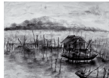
ภาพประกอบที่ 13 นางสาวยามิษฐ์ ทะชี เดรยอบบนกระดาน