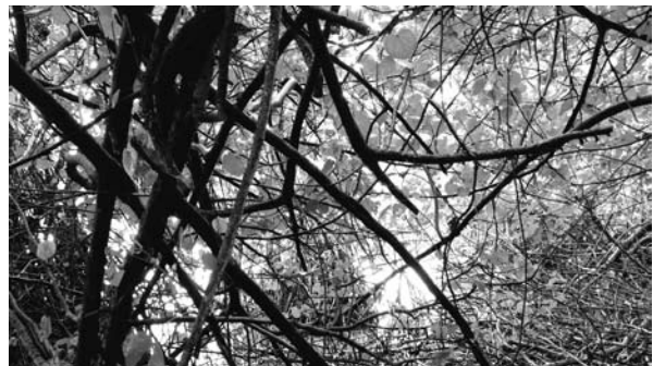
ภาพประกอบที่ 1-4 บรรยากาศอันสวยงามของกลุ่มน้ำทะเลสาบสงขลา