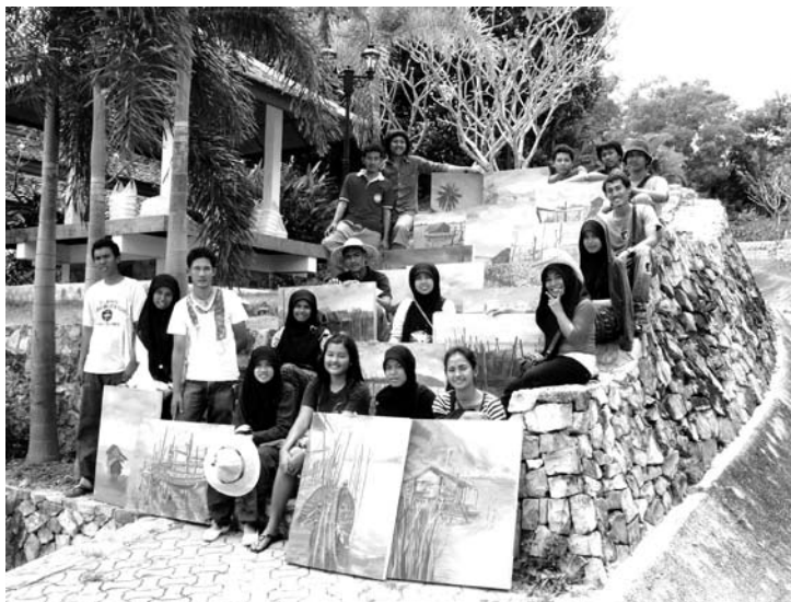
ภาพประกอบที่ 9 กลุ่มเยาวชนที่เข้าร่วมโครงการ

ถ่ายทอดเป็นผลงานศิลปกรรม โดยสร้างสรรค์ผลงานตามความถนัด และในครั้งนี้ผู้เข้าร่วมโครงการมีผลงานสร้างสรรค์ไม่น้อยกว่าคนละ 3 ชิ้น ในขนาดไม่ต่ำกว่า 80x100 ซม. โดยคณะจะทำการศึกษาคัดเลือกผลงานที่มีคุณภาพมอบให้คณะกรรมการตัดสินสิ่งแวดล้อมและมีสูจิบัตรนิตยสารจำนวน 1,000 เล่ม เป็นรายงานการจัดกิจกรรมทั้งแบบภาพนิ่งและภาพเคลื่อนไหว