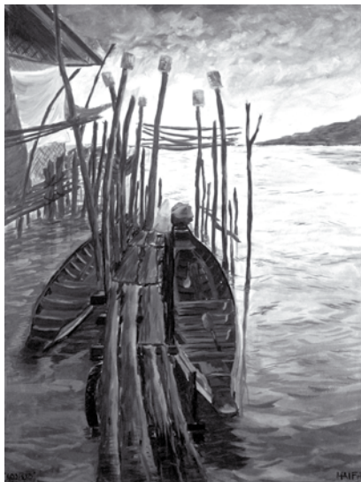
ภาพประกอบที่ 14 นางสาวชัยพะ สายี สีฝุ่นบนผ้าใบ