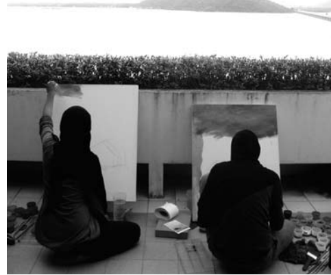
ภาพประกอบที่ 7-8 บรรยากาศในการปฏิบัติงาน

และในการเข้าร่วมสร้างสรรค์ผลงานครั้งนี้มีผู้เข้าร่วมโครงการที่ได้รับการคัดเลือกจำนวน 23 คน โดยมีกระบวนการศึกษาสภาพแวดล้อมโดยรอบทะเลสาบสงขลา บริเวณเกาะยอ เพื่อเรียนรู้วิถีชีวิตของคนในชุมชน ตลอดจนถึงศิลปวัฒนธรรม โบราณสถาน ภูมิปัญญาท้องถิ่น และแหล่งท่องเที่ยวบริเวณลุ่มน้ำทะเลสาบสงขลา และเลือกสถานที่เป็นการเฉพาะตามที่ตนเองเห็นว่าควรค่าแก่การศึกษาและการ