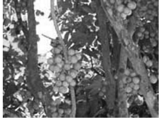
ภาพที่ 10 สวนลองกองที่ปลูกผสมผสาน กับผลไม้อื่นๆ อีกมากมาย