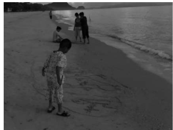
ภาพที่ 7 และ 8 เด็กๆ เพลิดเพลินกับการเล่นทรายบนชายหาดอย่างอิสระเสรี