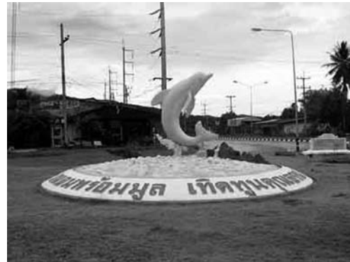
ภาพที่ 2 รูปปั้นปลาโลมาสีชมพู

อีก 17 กิโลเมตร จึงจะถึงตัวอำเภอขนอม ผู้ที่จะไปท่องเที่ยวควรจะเดินทางในช่วงกลางวันจะสะดวกกว่ากลางคืน เพราะในเวลากลางคืนริมทางจะมีมืดมากอาจจะเดินทางลำบาก