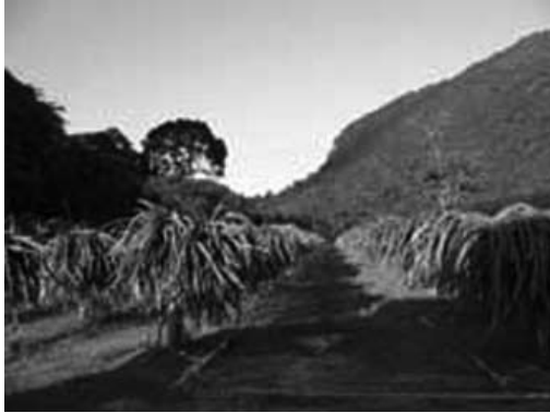
ภาพที่ 9 สวนแก้วมังกรที่มีรสชาติหวาน เนื้อแน่น บรรยากาศสวยงาม