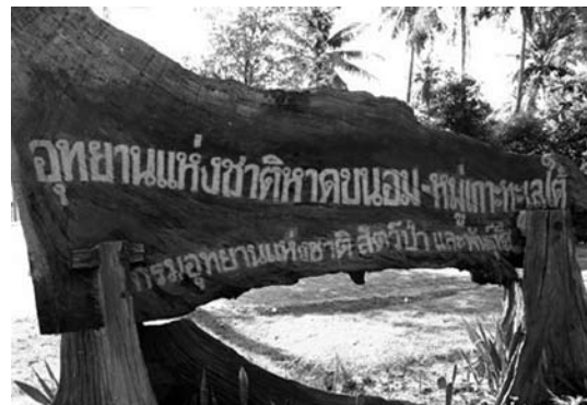
ภาพที่ 3 แสดงแผ่นป้ายบอกอุทยานแห่งชาติหาดขนอม ของกรมอุทยานแห่งชาติ สัตว์ป่าและพืชพันธุ์

แหล่งท่องเที่ยวในตัวอำเภอขนอมรวมกันเรียกว่า “อุทยานแห่งชาติหาดขนอม-หมู่เกาะทะเลใต้” จะมีป้ายที่ทำด้วยไม้บอกสถานที่ตั้งเด่นเป็นสง่าให้นักท่องเที่ยวมั่นใจว่ามาถูกที่แล้ว