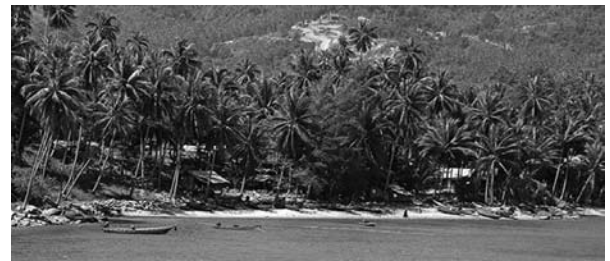
ภาพที่ 4- 6 อ่าวขนอม