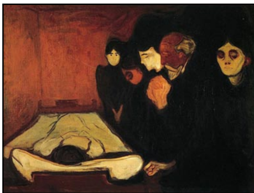
B ภาพประกอบที่ 2 Edvard Munch. The Death Bed . 1895. Oil on canvas. 90 x 120.5 cm. Rasmus Meyer Collection, Bergen, Norway.