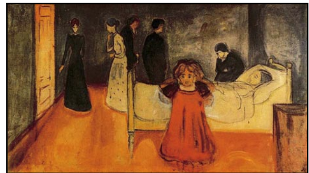
E ภาพประกอบที่ 5 Edvard Munch. The Dead Mother and the Child . 1897/99. Oil on canvas. 104.5 x 179.5 cm. Munch Museum, Oslo, Norway.