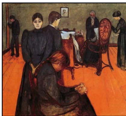
C ภาพประกอบที่ 3 Edvard Munch. Death in the Sick Chamber . 1895. Oil on canvas. 150 x 167.5 cm. Nasjonalgalleriet, Oslo, Norway.

ภาพประกอบที่ 1-5 นั้น (A-E) แสดงภาพผลงานของ Edvard Munch เป็นตัวอย่างในการวิเคราะห์ความเป็นเอกภาพในผลงานของศิลปินสัญลักษณ์ (Symbol) ที่ใช้ในการแสดงออก ในผลงานจิตรกรรมและภาพพิมพ์ของ Edvard Munch มีความคิดที่มีความหมายในตัว มีการจัดระเบียบและเหมาะสมที่จะแสดงออกด้วยรูปทรงสะท้อนถึงความโศกเศร้า จากการสูญเสียอันเนื่องมาจากความตายของบุคคลที่ศิลปินมีความผูกพัน