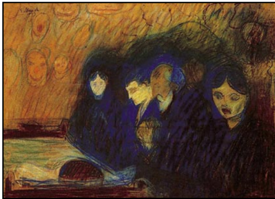
A ภาพประกอบที่ 1 Edvard Munch. By the Deathbed (Fever) . 1893. Pastel on board. 60 x 80 cm. Munch Museum, Oslo, Norway.