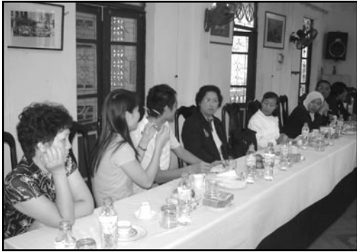
บรรยากาศการต้อนรับ อย่างเป็นกันเอง