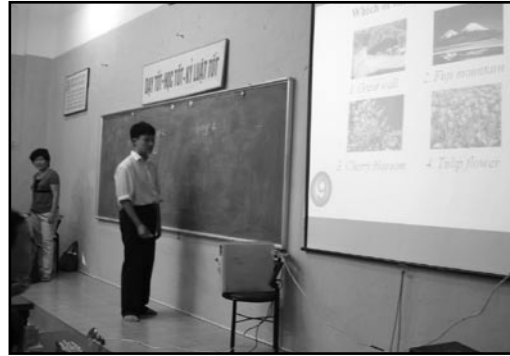
สื่อ อุปกรณ์ รูปแบบการสอน