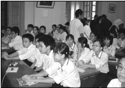
สภาพห้องเรียนในการจัดการเรียนการสอน