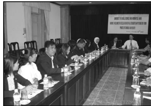
ภาพบรรยากาศในการเยี่ยมชมในมหาวิทยาลัยมนุษยศาสตร์และสังคมศาสตร์ กรุงฮานอย

หลังจากการพูดคุยซักถามแนะนำตัวแล้ว ได้รับรายงานว่ามหาวิทยาลัยแห่งนี้มีอาจารย์ทั้งสิ้น 489 คน นักวิจัย 123 คน และมีจำนวนนักศึกษา 12,500 คน แยกเป็นนักศึกษาระดับปริญญาตรี 11,100 คน และนักศึกษาระดับปริญญาโท และ