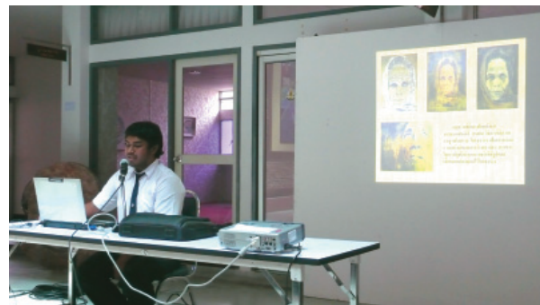
นักศึกษานำเสนอผลการศึกษาจากกระบวนการสร้างสรรค์ผลงานในรายวิชาระเบียบวิธีวิจัยทางทัศนศิลป์

แต่มีข้อแม้นิดเดียวครับว่าศิลปะในทุกสาขาวิชานั้นคิดอย่างเดียวไม่ได้ ต้องลงมือทำและในทางกลับกัน ทำอย่างเดียวนั้นไม่ได้ต้องใช้ความคิดด้วย