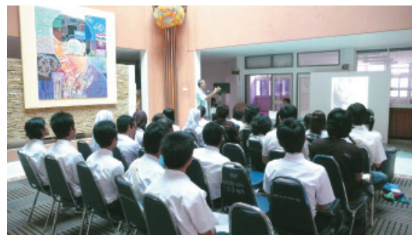
นักศึกษารับฟังข้อเสนอแนะจากคณาจารย์เป็นสิ่งสำคัญเพื่อการพัฒนาให้เป็นที่ไปตามเป้าหมายที่วางไว้

ผมขอยกตัวอย่างการเรียนการสอนในรายวิชาระเบียบวิธีวิจัยทางทัศนศิลป์ที่เราสอนกันในคณะเป็นรายวิชาสำหรับนักศึกษาชั้นปีที่ 4 ในหลักสูตรศิลปบัณฑิต ถือว่าเขาเดินมาใกล้ถึงเส้น