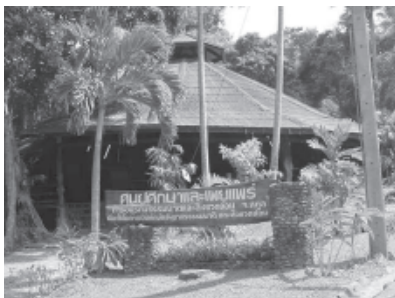
บึงทะเลบันและอาคารที่ประชุม อาคาร 16 เหลี่ยม

เส้นทางการเดินป่านั้นมีหลายเส้นทาง เส้นทางที่เราจะเดินนี้เป็นเส้นทางระยะสั้น เพียง 600 เมตร แต่ถึงแม้จะเป็นระยะทางสั้นๆ แต่ก็เต็มไปด้วยความหลากหลายของพันธุ์พืช เช่น ตะเคียน สักน้ำ สะตอ เต่าร้าง เต่าร้างแดง แซะ ลำเภา หลาวชะโอนเขา จิกนา ดินนง มะปริง มะไฟฝรั่ง ยางมันหมู ตะเคียนเต่า หมากลิง และหลุมพอที่มีอยู่เป็นจำนวนมาก พื้นที่ค่อนข้างลาดชันมีเถาวัลย์เลื้อยไปมา บรรเลงด้วยเสียงจักจั่นที่กึกก้องไปทั่วป่า สักพักเจ้าหน้าที่นำทางของเราชี้ให้เห็นต้นตาว ลูกชิดที่ใส่ในขนมหวานน้ำแข็งใส มีอยู่เยอะพอสมควรในป่าแห่งนี้