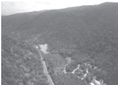
บึงน้ำขนาดใหญ่กลางหุบเขา ขนาบด้วยเทือกเขาจีนและเขาวังประ

ภายหลังการเดินทางป่าชมธรรมชาติพอมีเวลาผ่อนคลายบริเวณทางเดินไม้ระแนงที่ปัจจุบันผู้ไปตามกาลเวลา แต่ก็ยังคงความสวยงาม สะท้อนถึงสัญลักษณ์ของอุทยานแห่งชาติทะเลบันที่ทอดยาวไปตามบึงน้ำขนาดใหญ่กลางหุบเขา ขนาบด้วยเทือกเขาจีนและเขาวังประ นอกจากนี้สัญลักษณ์อื่นๆ ที่เป็นเอกลักษณ์ของทะเลบัน คือ ต้นบากงที่มีอยู่รอบบึงมีขึ้นอยู่อย่างหนาแน่น และเป็นที่อยู่ของเงี้ยววัก สัตว์ครึ่งบกครึ่งน้ำ พอถึงยามค่ำคืน ทั่วทั้งดงดิบโดยรอบระงมด้วยเสียง “วัก วัก วัก” จนชาวบ้านเรียกว่า “หมาน้ำ” กลายเป็นสัญลักษณ์ของผืนป่าและผืนน้ำแห่งนี้