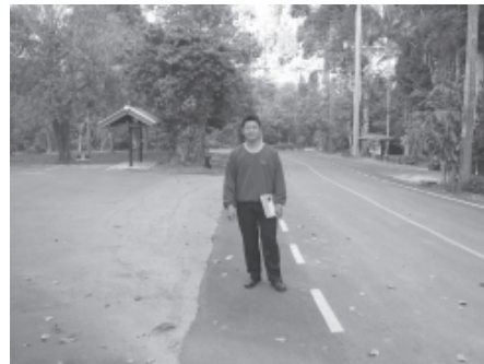
เช้าวันสุดท้ายของการประชุม ระหว่างรอสมาชิกท่านอื่นๆ ขอโพสทำถ่ายรูปก่อน

เช้าวันสุดท้ายของการประชุม ท้องฟ้าแจ่มใส แสงแดดสาดส่องกระทบยอดเขาเป็นแสงแดดอ่อนๆ ที่สื่อความหมายของการเริ่มต้นวันใหม่ บรรยากาศเงียบสงบ อุณหภูมิเย็นสบาย อาหารเช้าของเรานั้นเป็นข้าวต้มไก่ ข้าวเหนียวปิ้ง เสริฟพร้อมกาแฟร้อนๆ รสชาติดีทีเดียว ทันใดนั้นสายตาก็จับจ้องไปที่เจ้ากระรอกน้อยที่วิ่งไปมาอยู่บนต้นไม้ ซึ่งคงกำลังมองด้วยความสงสัยว่าพวกเราเป็นใครมาทำอะไรที่นี่ แต่ในใจก็คิดว่ามันคงจะเคยชินกับมนุษย์ เพราะไม่มีอาการตื่นตกใจแต่อย่างใด ต่อมาเมื่อเสียงบ่นดังขึ้นมา