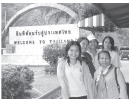
ขณะอยู่ที่ด่านพรมแดนวังประจัน รอยต่อประเทศมาเลเซีย