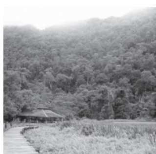
อุทยานแห่งชาติทะเลบัน กรมอุทยานแห่งชาติ สัตว์ป่าและพันธุ์พืช กระทรวงทรัพยากรธรรมชาติและสิ่งแวดล้อม