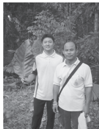
ขณะเดินป่าชมธรรมชาติอุทยานแห่งชาติทะเลบัน