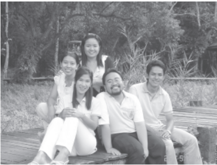
พอมีเวลาถ่ายรูปร่วมกันก่อนที่จะไปที่จุดนัดพบ เพื่อรับประทานอาหาร และประชุมต่อในช่วงค่ำ

ประชุมวันแรกเสร็จสิ้น เวลา 20.30 น. ต่างคนก็แยกย้ายกันกลับที่พักเพื่อต้องการพักผ่อน หลังจากเหน็ดเหนื่อยกันมาทั้งวันแล้ว ระหว่างทางกลับภาพที่เห็นเบื้องหน้ากับทำให้ความเหนื่อยหายไปอย่างปลิดทิ้ง คือ ภาพดวงไฟที่มีอยู่ตามทางเดินไม้ตัดกับฉากหลังที่โอบล้อมด้วยภูเขาสูงตระหง่าน และทั้งหมดอยู่ภายใต้ฟากฟ้าที่ประดับประดาไปด้วยหมู่ดาว ระยิบระยับเต็มท้องฟ้า ระงมไปด้วยเสียงหมา น้ำ ที่ไหลบออยู่ภายใต้ต้นบ่างที่ขึ้นอยู่อย่างหนาแน่น เริ่มดึกอากาศก็เริ่มเย็นค่านั่นนอนหลับฝันดีแน่นอน