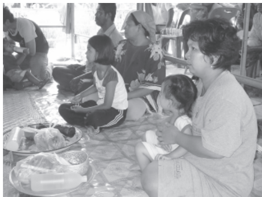
ตัวอย่างเด็กที่เป็นแสนแดง ครอบครัวหนึ่งเดินทางมาจากจังหวัดนครราชสีมา ส่วนอีกครอบครัวหนึ่งเป็นครอบครัวมุสลิมในพื้นที่ เพื่อต้องการให้นายโรงโนราคณะเฉลิมศิลป์เหยียบแสน (ภาพถ่ายเมื่อ 18 เมษายน 2550)

การเหยียบแสน เพื่อยับยั้งไม่ให้แสนขยายใหญ่โตขึ้นตามวัยของเด็กหนุ่มสาว ถ้าต้องการให้แสนหายขาด ต้องเหยียบกับนายโรงโนรารองครุ 3 ครั้ง นายโรงโนราที่ผ่านพิธีกรรมการตัดจุกจากคณะโนราต่างๆ มาแล้วเท่านั้น ที่จะเหยียบแสนให้หายขาดได้ นายโนราที่ยังไม่ได้ผ่านการตัดจุกมาก่อน จะไม่สามารถเหยียบแสนให้หายขาดได้ และการเหยียบแสนนั้น ต้องเหยียบให้ครบ 3 ครั้ง จะเหยียบกับนายโนราเดียวกันก็ได้ แต่ต้องพาบุตรหลานไปเหยียบครั้งต่อไป ตามสถานที่อื่นๆ ที่นายโรงโนราทำการแสดง จนครบ 3 ครั้ง การเหยียบแสนกับ