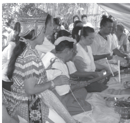
โนรารำรำการเปิดพิธีโนราโรงครุ และพิธีกรรมการทรงการเล่นของคณะ “เฉลิมศิลป์” ที่บ้านดี จังหวัดปัตตานี (ภาพถ่ายเมื่อ 26 เมษายน 2550)