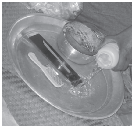
สิ่งของที่ต้องเตรียมเพื่อนำมามอบให้กับนายโรงโนรารองครุคณะ "เฉลิมศิลป์" (ภาพถ่ายเมื่อ วันที่ 18 เมษายน 2550)