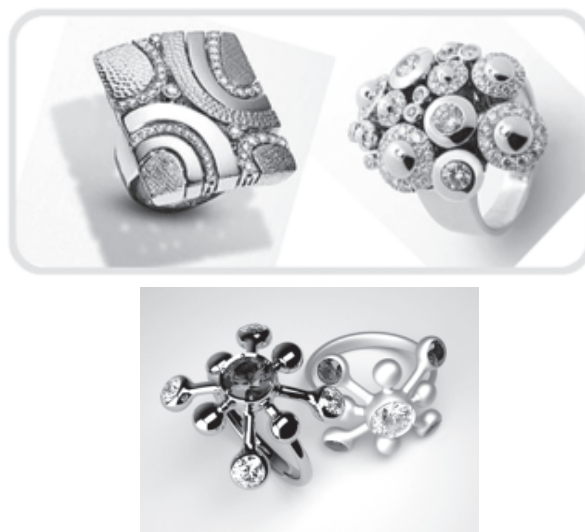
ภาพที่ 1, 2 : การใช้ความคิดสร้างสรรค์ด้านความงามทางศิลปะ มาใช้ในการออกแบบรูปแบบของหัวแหวน ที่มีความน่าสนใจ ดูสะดุดตา

3. ความคิดสร้างสรรค์ด้านความงาม สำหรับความคิดสร้างสรรค์ในด้านนี้ จะมุ่งที่ความงามที่มีลักษณะแปลกใหม่เป็นหลัก เป็นความสวยงามที่เปลี่ยนแปลงได้ซึ่งความคิดสร้างสรรค์ด้านความงามนี้นับว่าเป็นส่วนหนึ่งของการสร้างสรรค์งานศิลปะทุกประเภท รวมทั้งเป็นหัวใจสำคัญของการสร้างงานเครื่องประดับ