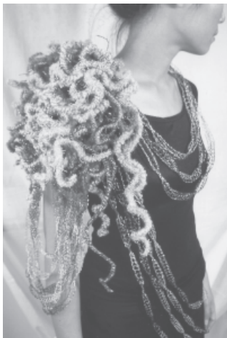
ภาพที่ 3, 4 : ความคิดสร้างสรรค์ในการออกแบบเครื่องประดับ โดยคำนึงถึงการจัดวาง สวมใส่บนร่างกาย