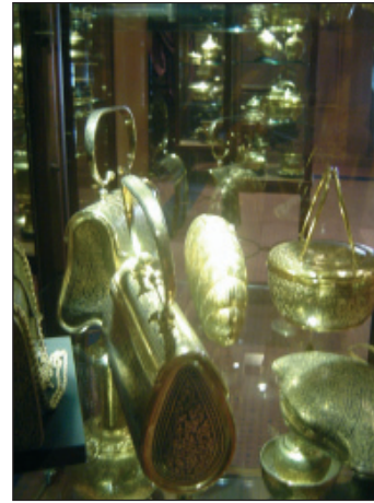
บรรยากาศภายในห้องแสดงนิทรรศการ เครื่องถมไทย

กระผมจึงได้นำเครื่องถมทอง และเครื่องจักสาน ย่านลิเภาที่เก็บสะสมไว้มานำจัดแสดง เพื่อให้ประชาชนในจังหวัดปัตตานีและจังหวัดใกล้เคียง ตลอดจนนักท่องเที่ยวทั้งชาวไทยและชาวต่างประเทศ ได้รับความรู้และร่วมภาคภูมิใจในงานศิลปหัตถกรรม ชั้นเลิศ เพื่อเผยแพร่มรดกทางวัฒนธรรมอันเป็นเอกลักษณ์ของชาวใต้ให้เป็นที่ประจักษ์ และคงอยู่คู่ ถูกลานไทยตลอดไป...”