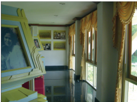
บรรยากาศภายในห้องแสดงนิทรรศการพระราชกรณียกิจขององค์พระบาทสมเด็จพระเจ้าอยู่หัวและพระบรมวงศานุวงศ์