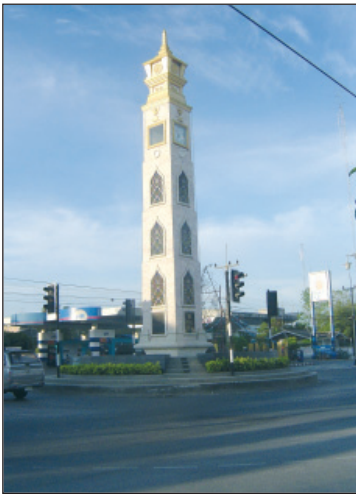
วงเวียนหอนาฬิกา

นอกจากมหาวิทยาลัยสงขลานครินทร์ วิทยาเขตปัตตานี จากถนนเจริญประดิษฐ์ถึง วงเวียนหอนาฬิกา แล้วเลี้ยวขวา ตรงไปแะที่โรงแรม ซี.เอส.ปัตตานี (C.S. Pattani)