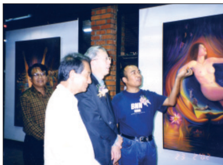
บรรยากาศภายในห้องแสดงนิทรรศการศิลปกรรม ร่วมสมัย ในหอศิลป์สยาม