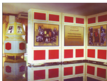
หอศิลป์นครหาดใหญ่เฉลิมพระเกียรติ