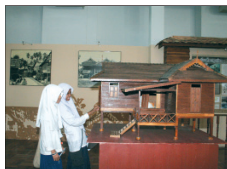
บรรยากาศการแสดงผลงานศิลปกรรมร่วมสมัยในหอศิลป์ภาคใต้