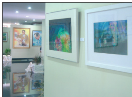
บรรยากาศภายในห้องแสดงนิทรรศการศิลปกรรมร่วมสมัย