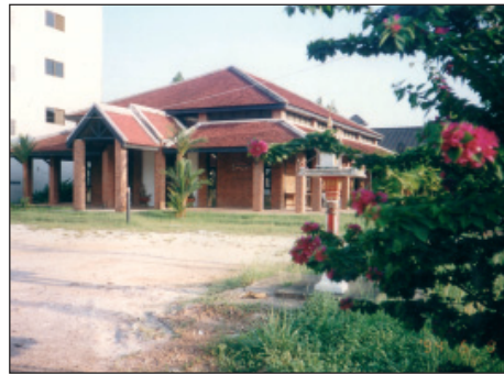
หอศิลป์สยาม