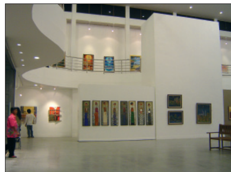
บรรยากาศการแสดงผลงานศิลปกรรมร่วมสมัยในหอศิลป์ภาคใต้

กลุ่มอาคารหอวัฒนธรรมภาคใต้ จัดให้มีการแสดงนิทรรศการถาวร (Permanent Exhibitions) ที่เกี่ยวกับวัฒนธรรมต่างๆ ในภาคใต้ อาทิเช่น