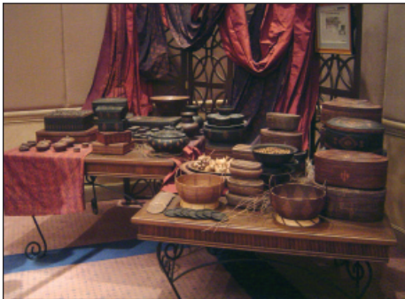
บรรยากาศภายในห้องแสดงนิทรรศการ เครื่องจักสานย่านลิเภา

ห้องนิทรรศการทั้ง 2 ห้องนี้ อยู่ที่ชั้นสอง เหนือเคาน์เตอร์รับแขกของโรงแรม นักเรียน นักศึกษา และประชาชนผู้สนใจสามารถติดต่อเข้าเยี่ยมชม โดย มีวิทยากรคอยให้ความรู้ที่โรงแรม ซี.เอส. ปัตตานี (C.S. Pattani) ได้ทุกวัน