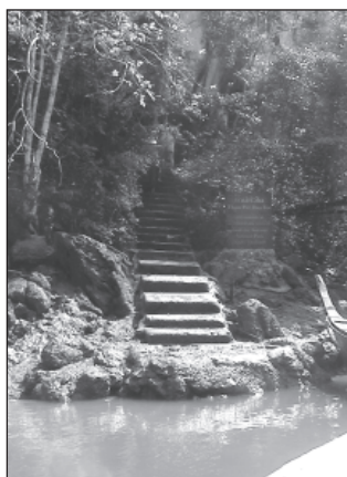
ภาพประกอบที่ 2 ทางขึ้นสู่ตัวถ้ำผีหัวโตเป็นบันไดซีเมนต์ไปตลอดจนถึงปากถ้ำซึ่งปรากฏภาพจิตรกรรมที่น่าสนใจหลายกลุ่มคอยต้อนรับผู้มาเยือนทั้งในและต่างประเทศซึ่งจะมีทั้งชาวเอเชียและยุโรป เป็นต้น