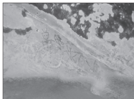
ภาพประกอบที่ 4 เป็นภาพกลุ่มที่ 22 ภาพในกลุ่มนี้เป็นกลุ่มภาพที่ใหญ่ที่สุด ยาวไปตลอดแนว ดูแล้วคล้ายกับการแห่ขบวนที่สนุกสนาน ได้สะท้อนถึงการอยู่ร่วมกันอย่างสงบสุขมาตั้งแต่อดีต

ศิลปกรรมท้องถิ่นไม่เพียงแต่จะเป็นสื่อกลางในการถ่ายทอดภูมิปัญญาจากบรรพบุรุษสู่คนรุ่นหลังเท่านั้น แต่ยังสามารถสร้างงาน สร้างรายได้ให้แก่คนในชุมชน เพราะส่วนมากแล้วศิลปกรรมท้องถิ่นมักเป็นสถานที่ท่องเที่ยวพักผ่อนหย่อนใจของนักท่องเที่ยวมากกว่าการเข้าไปศึกษาหาความรู้และการเข้าไปดูแลรักษา ทำให้เกิดอาชีพต่างๆ มากมายของคนในชุมชนนั้น ไม่ว่าจะเป็นการค้าขาย ไกด์นำเที่ยว ฯลฯ แต่ประโยชน์อันก่อให้เกิดต่อชุมชนมากที่สุดก็คือความเป็นรากเหง้าที่รับมาโดยการซึมซับในวิถีชีวิตของความเป็นอยู่ประเพณีอันดีงามมาตั้งแต่อดีตผ่านการถ่ายทอดประสบการณ์ความรู้ให้คนรุ่นหลังและสามารถนำไปปฏิบัติและสืบทอดรุ่นสู่รุ่น ทั้งนี้เพื่อไม่ให้ประเพณี และศิลปวัฒนธรรมที่ดีงามสูญหายไป