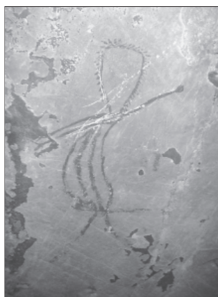
ภาพประกอบที่ 3 ภาพกลุ่มที่ 6 แสดงภาพภายในถ้ำบริเวณเพดานต่ำๆ เป็นภาพที่เด่นที่สุด เขียนด้วยสีแดงเป็นลายเส้นโครงร่างภายนอกของมนุษย์ และตกแต่งภายในลำตัวเป็นลายเส้นตามยาวในลักษณะแสดงอาการเคลื่อนไหว ยกแขนและเอียงตัว แขนข้างขวามี 2 แขน นิ้วมือทั้งสองแขนรวมกันได้ 5 นิ้ว ไม่แสดงรายละเอียดบนใบหน้า