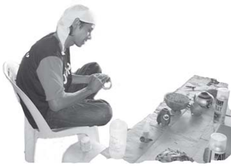
ภาพการสาธิตในงานมหกรรมศิลปวัฒนธรรมครั้งที่ 14

ทุกคนภายในชมรมต้องทำงานพิเศษไม่เว้นแม้แต่ประธาน และรองประธาน จากคำบอกกล่าวของสมาชิกว่า ทุกวันประธาน จะต้องหาเงินเข้าชมรม โดยไปขอทำงานภายในชุมชนต่อกำนัน ผู้ใหญ่บ้าน และตามหมู่บ้านต่างๆ ซึ่งสมาชิกภายในชมรมสามารถ ทำงานได้ทุกอย่างที่เป็นงานสุจริตภายในชุมชนให้ผู้ว่าจ้างบอกมา และทุกวันนี้สมาชิกส่วนหนึ่งก็มีรายได้จากการเข้าไปเป็นสมาชิก ลิเกฮูลู คณะแหลมทราย ซึ่งในคืนวันที่ 10 กรกฎาคม 2549 ก็มีโอกาสดำเนินงานเวทีในงานมหกรรมศิลปวัฒนธรรมด้วย