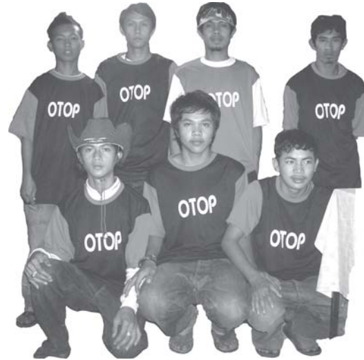
สมาชิกบางส่วน of ชมรม

การตั้งชื่อเรื่องว่าวัยรุ่นกับภูมิปัญญาท้องถิ่น ไม่ได้ให้ความหมายกับวัยรุ่นโดยทั่วไป แต่จะกล่าวถึงวัยรุ่นกลุ่มหนึ่งที่ได้เข้าร่วมกิจกรรมงานมหกรรมศิลปวัฒนธรรมครั้งที่ 14 ทางมหาวิทยาลัยสงขลานครินทร์ วิทยาเขตปัตตานี ได้จัดขึ้นระหว่างวันที่ 2-10 กรกฎาคม 2549 ที่ผ่านมามีร้านค้าหน่วยงานราชการ เอกชน และการสาธิตและจำหน่ายสินค้า OTOP เข้าร่วมทำกิจกรรมต่างๆ มากมาย แต่ที่จะนำเสนอในวันนี้ เป็นกลุ่มวัยรุ่นจากบ้านป่าหลวง ตำบลยามู อำเภอยะหริ่ง จังหวัดปัตตานี ที่ได้รวมกลุ่มกันสร้างชิ้นงานขึ้นมาโดดเด่นต่อผู้คนที่เข้าร่วมชมงานมหกรรมศิลปวัฒนธรรม ครั้งที่ 14 วัยรุ่นกลุ่มนี้ได้จัดตั้งชมรมด้วยการนำเอากะลามะพร้าวที่มีอยู่ในท้องถิ่นของตนเองนำมาสร้างชิ้นงานในนาม “ชมรมเตะกระป๋อง”