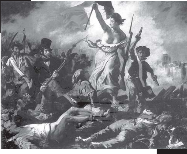
ภาพจิตรกรรมรูปแบบจินตนิยม (ROMANTICISM) เป็นจิตรกรรมสมัยโรแมนติกของยุโรป

ผลงานที่แสดงความเป็นโรแมนติกนิยมในทางศิลปกรรมนั้น จะต้องนำเสนอเรื่องราวเนื้อหาของธรรมชาติอย่างเที่ยงตรงและเต็มไปด้วยศรัทธา กล่าวคือ ต้องทำหน้าที่ประจักษ์กระจกเงาสท้อนให้เห็นสิ่งต่างๆ ในธรรมชาติ โดยใส่อารมณ์จินตนาการ และความฝันส่วนตัวให้น้อยที่สุด หรือแทบจะไม่มีเลยก็ได้เช่นกัน