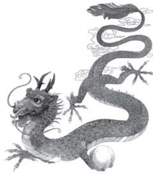
มังกรจีน (เออร์เนสต์ เดรก, 2549. : 4)

หัวหน้า ดังเช่นลวดลายมังกรบนฉลองพระองค์ของฮ่องเต้ ลักษณะห้าเล็บของมังกรจะแสดงถึงความเป็นผู้นำ เป็นเครื่องหมายของผู้ที่มียศสูงสุด จากความเชื่อเรื่องมังกรส่งผลให้ชาวจีนนิยมนำหยกมาทำเป็นแหวนและเป็นรูปมังกรคาบแก้วแล้วสวมติดตัวตลอดเวลา เมื่อใดที่จะต้องข้ามแม่น้ำหวงเฮอ ก็จะถอดแหวนมังกรทิ้งลงไปใ้แม่น้ำ เพื่อเซ่นสรวงมังกร เพราะเชื่อว่ามังกรจะช่วยคุ้มภัยอันตรายได้และทำให้การเดินทางปลอดภัย ซึ่งความเชื่อลักษณะนี้ ตรงกับความเชื่อของชาวเกลาเซียผู้ปุ่นว่า ทะเลที่มีคลื่นลมปั่นป่วนเกิดจากความพิโรธของมังกร ดังนั้นจะต้องโยนเพชรนิลจินดาลงไปในทะเล เพื่อเป็นการเซ่นสรวงมังกรและทำให้คลื่นลมสงบได้