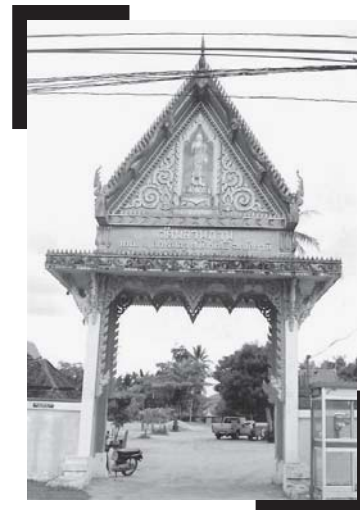
ภาพประกอบที่ 1 บริเวณซุ้มประตูด้านหน้าปากทางเข้าวัด อยู่ตรงกันข้ามกับสถานที่ราชการของ ตำบลทุ่งพลา

สำหรับการเดินทางไปยังวัดพลาณภาพ สามารถใช้เส้นทางปัตตานี-ยะลา (สายผ่านอำเภอโคกโพธิ์) ในช่วง สามแยกบ้านเกาะตาเลียวซ้ายผ่านถนนซอย มุ่งตรงไปวัดระยะทางประมาณ 1,300 เมตร จะมองเห็นซุ้มประตูทางเข้าวัดอยู่ด้านหน้าติดกับถนนส่วนด้านหน้าวัดจะหันไปทางทิศเหนือสำหรับพื้นที่ของวัดมีเนื้อที่ประมาณ 17 ไร่ และมีอาณาเขตติดกับหมู่บ้านชาวไทยพุทธและมุสลิมซึ่งอยู่ร่วมกันอย่างสันติมาช้านาน