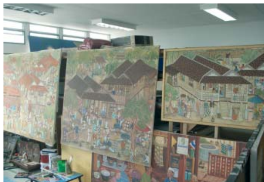
ภาพประกอบที่ 2 แสดงภาพตัวอย่างผลงานศิลปนิพนธ์ของนายเจ๊ะอับดุลเลาะ เจ๊ะสอเหาะ เรื่อง วิถีชีวิตชาวมลายูในท้องถิ่นสามจังหวัดชายแดนภาคใต้