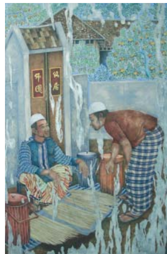
ภาพประกอบที่ 3 แสดงภาพตัวอย่างผลงานศิลปนิพนธ์ของนายอัมราม ดอกกา เรื่อง ประตูลู่สันติสุข