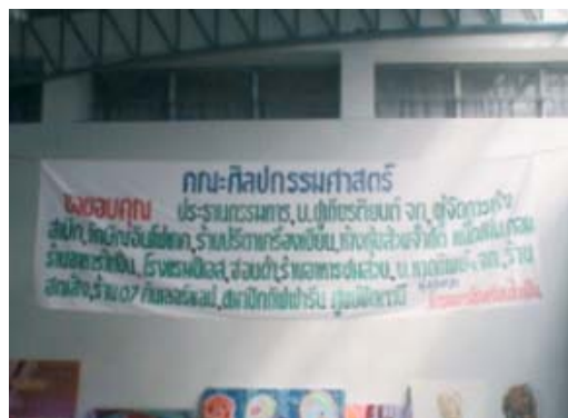
ป้ายขอขอบคุณผู้สนับสนุนโครงการโรงเรียนในฝัน สร้างสรรค์งานศิลป์ : วัฒนธรรมของเรา ครั้งที่ 2