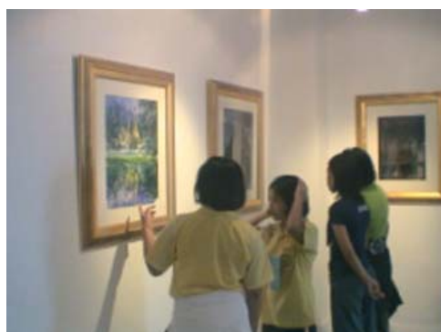
เยี่ยมชมหอศิลป์และบ้านเรือนไทย ณ มหาวิทยาลัยสงขลานครินทร์ วิทยาเขตปัตตานี