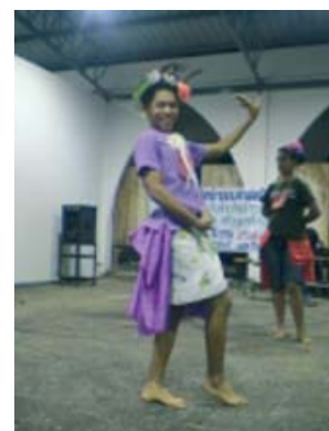
สโมสรนักศึกษาคณะศึกษาศาสตร์ (พี่เลี้ยง) จัดกิจกรรมสันตนาการให้แก่เยาวชนผู้เข้าร่วมโครงการฯ