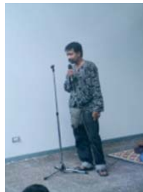
คณะศึกษาศาสตร์และศึกษาศาสตร์ให้เกียรติถ่ายทอดศิลปะการแสดงพื้นบ้าน