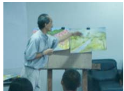
การวิพากษ์ผลงานศิลปะของเยาวชนผู้เข้าร่วมโครงการ โดยคณาจารย์คณะศิลปกรรมศาสตร์