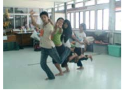
กระบวนการฝึกทักษะ ปฏิบัติ และสร้างสรรค์ผลงาน ของผู้เข้าร่วมโครงการฯด้านศิลปะการแสดง