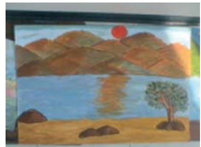
ผลงานของเยาวชนผู้เข้าร่วมโครงการโรงเรียนในพื้นที่