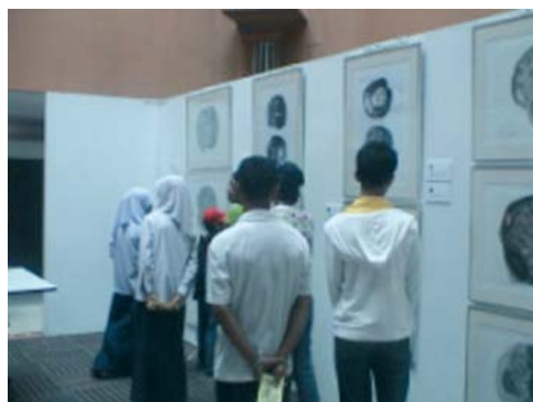
เยาวชนผู้เข้าร่วมโครงการเยี่ยมชมนิทรรศการผลงานสร้างสรรค์ประจำปีการศึกษา 2548