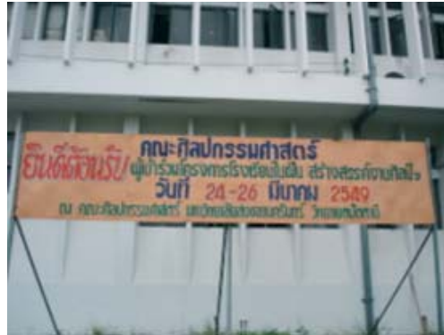
ป้ายประชาสัมพันธ์โครงการโรงเรียนในฝัน สร้างสรรค์งานศิลป์ : วัฒนธรรมของเรา ครั้งที่ 2