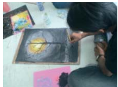
กระบวนการฝึกทักษะ ปฏิบัติ และสร้างสรรค์ผลงาน ของผู้เข้าร่วมโครงการฯด้านทัศนศิลป์