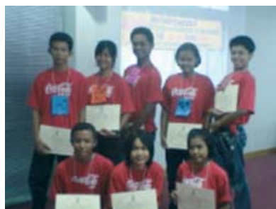
คณบดีคณะศึกษาศาสตร์มอบเกียรติบัตรแก่เยาวชนผู้เข้าร่วมโครงการ