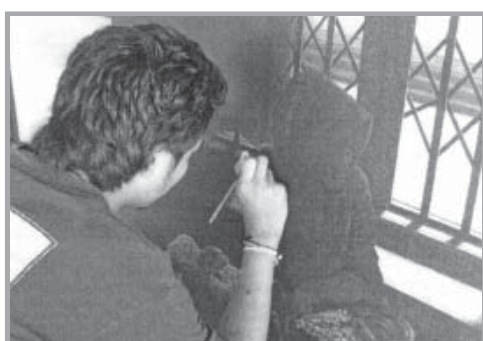
กระบวนการสร้างสรรค์ผลงานจิตรกรรม