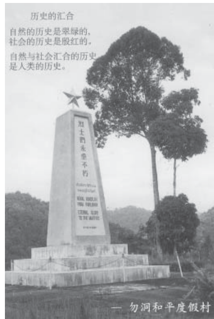
หมู่บ้านจุฬารัตน์พัฒนา