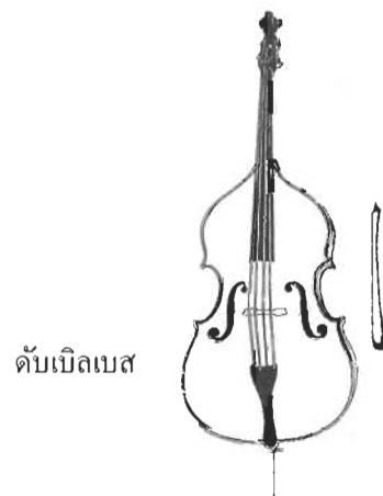
ดับเบิลเบส