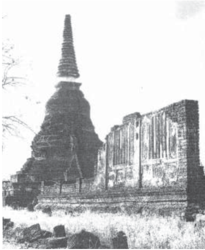
รูปที่ 1 เจดีย์และวิหารวัดนางพญาถ่ายจากทิศตะวันตกเฉียงใต้ (ม.จ. สุภัทรดิศ ดิสกุล, 2539 : 75)