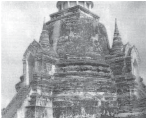
รูปที่ 5 เรือนธาตุเจดีย์ประธาน ชุมจรณะนำจตุรทิศ เป็นหน้ามุขขนาดเล็ก (สันติ เล็กสุขุม, 2535 : 37)

เจดีย์ประธานวัดนางพญาและเจดีย์ประธานวัดพระศรีสรรเพชญ์มีคุณค่าในฐานะงานสถาปัตยกรรมไทยในพุทธศาสนา ซึ่งเปรียบเสมือนกระจกเงาที่สะท้อนให้เห็นถึงอารยธรรมของชาติมีสองประการดังนี้