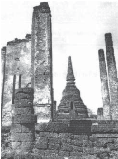
รูปที่ 2 วัดนางพญาถ่ายจากทิศใต้แลเห็นเจดีย์ศิลาแลงและวิหารซึ่งตั้งอยู่ด้านหน้า (ม.จ. สุภัทรดิศ ดิสกุล, 2539 : 74)

ในพระราชพงศาวดารกรุงเก่าระบุว่าเจดีย์ประธานของวัดพระศรีสรรเพชญ์ได้รับอิทธิพลจากเจดีย์ประธานวัดนางพญา เพราะเค้าโครงโดยรวมคล้ายคลึงกันมาก กล่าวคือ พระเจดีย์วัดนางพญามีมุขจรณะประจำ 3 ทิศ และมีมุขทางเข้าสู่คูหาเจดีย์