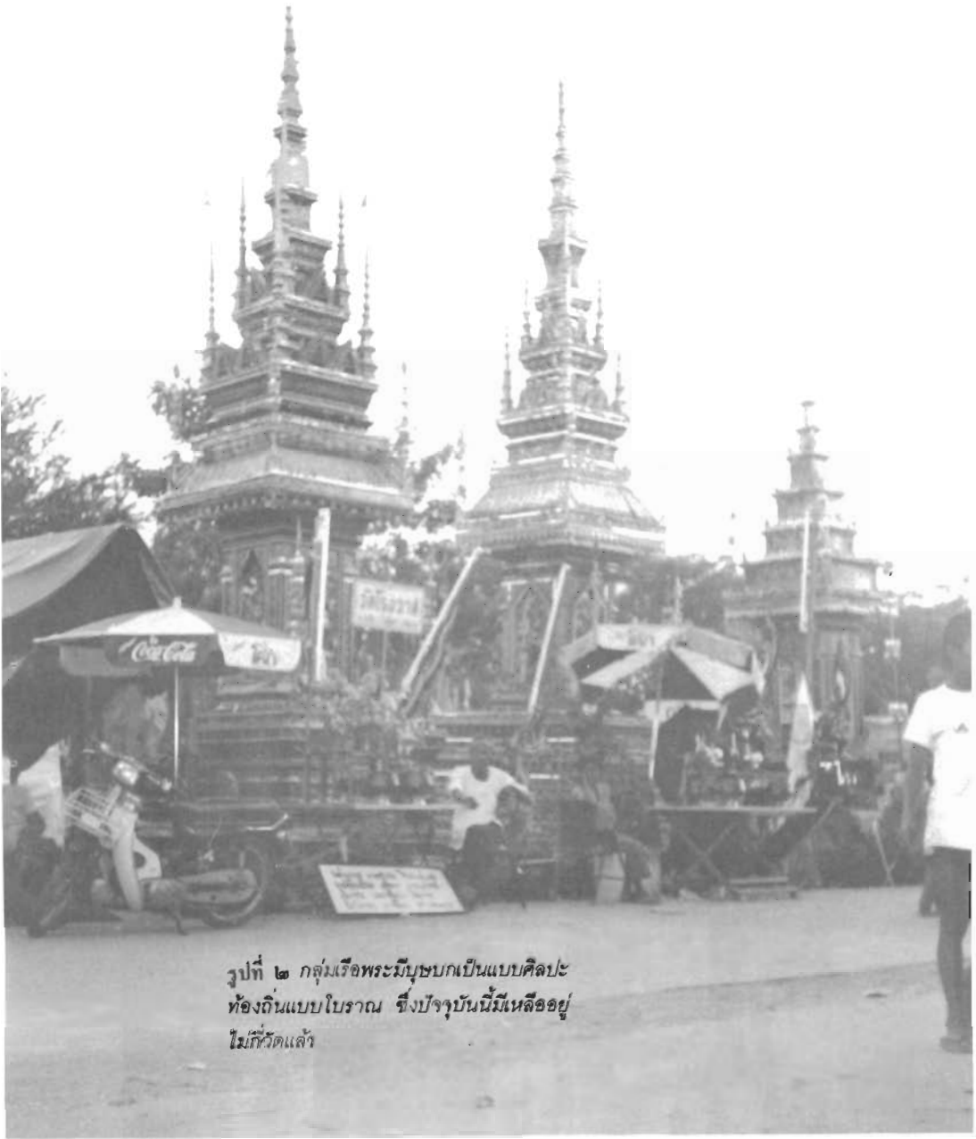
รูปที่ ๒ กลุ่มเจดีย์พระมุนีบุษบกเป็นแบบศิลปะ ท้องถิ่นแบบโบราณ ซึ่งปัจจุบันนี้มีเหลืออยู่ ไม่กี่วัดแล้ว