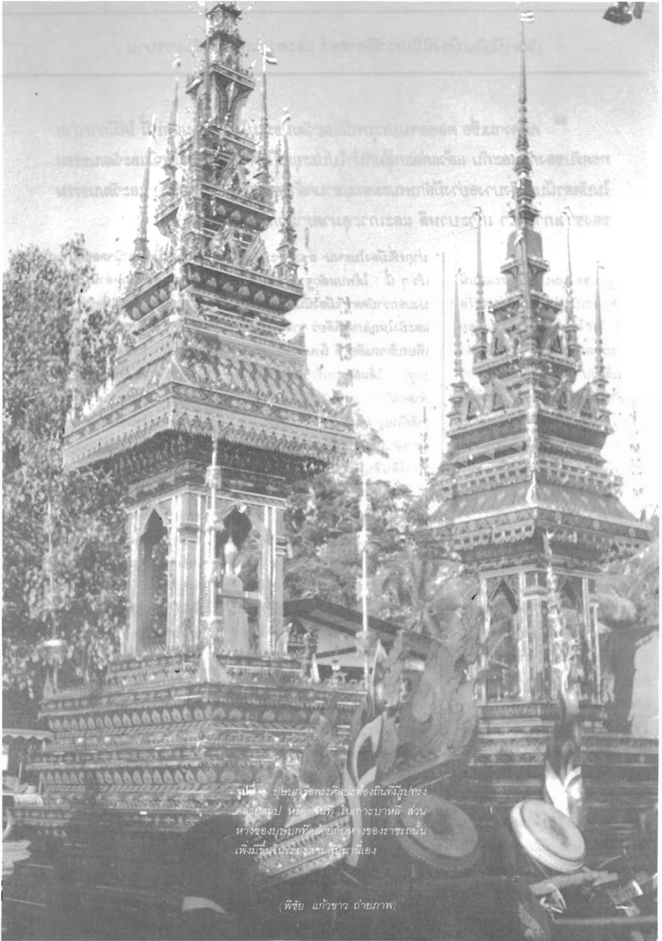
รูปที่ ๓ - บุษบกหรือพระศิวะทองดินที่มีรูปทรง คล้ายรูป หรือ รูปทิว ในเกาะบาทลี ส่วน หางของบุษบกที่คล้ายกับหางของราชรถนั้น เพิ่งมีขึ้นในรัชสมัยสมเด็จพระที่นั่งสุริยาศน์อมรินทร์