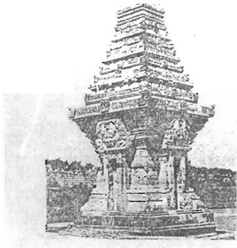
รูปที่ ๓ จันทิปะณะตะวันตก ศิลปะชวาภาคตะวันตก ออกมาเปรียบเทียบกับรูปทรงของ บุษบกเจดีย์พระแบบโบราณศิลปะท้องถิ่น

(ภาพจากหนังสือ บูหงำไป พระราชนิพนธ์ ในสมเด็จพระเทพรัตนราชสุดาฯ สยามบรม ราชกุมารี)