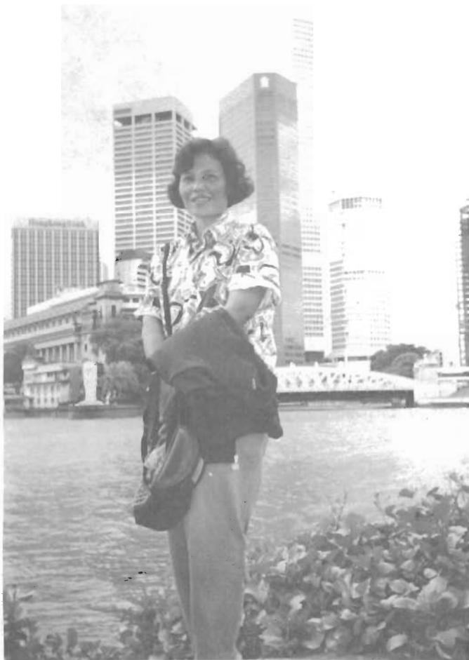
ติ๊กะฟ้า ปากแม่น้ำสิงคโปร์และ สิงโตทะเล

เมื่อก่อนนั้น...ใครก็ตามที่ได้รับ สิ่งดี ๆ โดยไม่คาดฝันหรือไม่ต้องลงทุน ลงแรงให้เหนื่อยยากแต่อย่างไร เช่น จู่ ๆ มีผู้ยกมรดกราคาสวมถึงสี่พัน ล้านบาทให้ หรือมีฐานะยากจนขั้นแค้น อดมื้อกินมื้อ แต่กลับได้แต่งงานกับ เศรษฐีมีเงินถุงเงินถัง เป็นต้น ผู้ใหญ่ เขาก็จะบอกว่า “บุญหล่มทับ” แต่วัน รุ่น พ.ศ.นี้ เขาจะเรียกว่า “ส้มหล่น” หากเป็นแฟนฟุตบอล ก็จะเติมคำว่า “ลูก” เข้าไปข้างหน้าอีกคำเป็น “ลูกส้ม หล่น” ซึ่งหมายถึงลูกที่บังเอิญหลุดมา เข้าเท้าและเตะเข้าประตูไป โดยไม่ ต้องออกแรงให้เหนื่อยยากแต่อย่างไร ฉันก็เลยขอยืมคำนี้มาใช้กับตัวเอง บ้าง เพราะฉันเป็นข้าราชการจน ๆ ได้