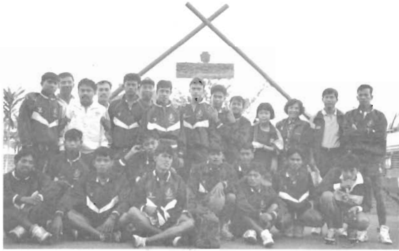
ทีมรักบี้มหาลัย ปี ๒๕๓๔

พูดถึงเรื่องข้ามถนน ฉันสังเกตว่าถนนแทบทุกสาย จะมีสัญญาณไฟเขียว-ไฟแดงสำหรับคนข้ามถนน แล้วเมื่อใดไฟเขียวปรากฏขึ้นพร้อมด้วยภาพคนกำลังก้าวเท้าอยู่ แสดงว่าข้ามได้ หากเมื่อใดแม่ไฟจะเขียวอยู่ก็ตามแต่ภาพคนมีลักษณะเหมือนกำลังวิ่งอยู่ล่อล่อ เขาจะหยุดทันที หากใครข้ามไปถือว่าผิดกฎหมายเกี่ยวกับจราจร และหาก