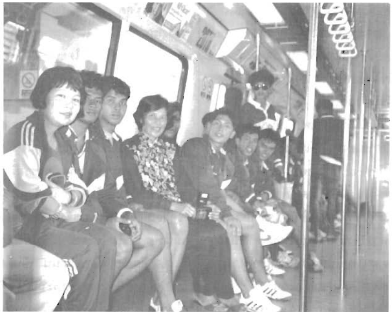
ส่วนหนึ่งของทีมภายใน "รถไฟฟ้าใต้ดิน"

ตอนบ่ายเรามีเวลาว่าง เพราะคู่ต่อสู้ ขอบายร์ (BYE) หัวหน้าคณะจึง