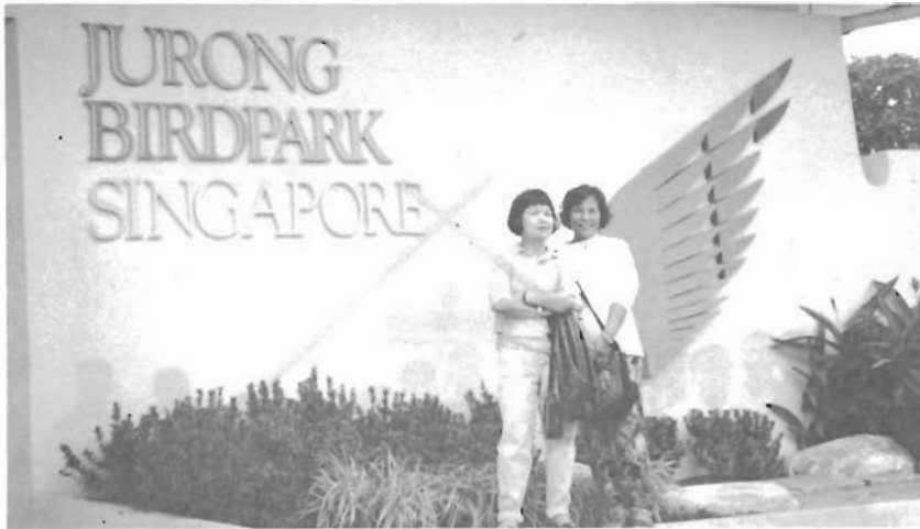
บริเวณด้านหน้าของสวนนกจูร่ง