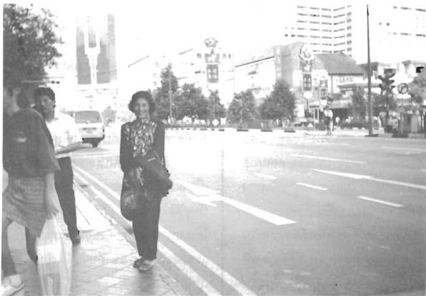
ริมถนนหน้า Pearl's CTR

จริงๆ กันวันนี้เอง ฉันถ่ายรูปไว้เป็นที่ ระลึกจนพอใจแล้ว จึงสมัครใจที่จะนั่ง พักผ่อนและดื่มน้ำดับกระหายที่แผงขาย เครื่องดื่มบริเวณใกล้ๆ ที่จอดรถ บรรยา การรอบกายน่าสนใจยิ่งนัก ฉันเห็น อาคารศาลสูง (Supreme Court) ตั้งเด่น เป็นสง่าอยู่ริมถนนแอนดรูว์ (St. An- drew’s Rd.) อาคารที่ว่าเป็นสถาปัตยกรรม แบบกรีก หลังคาเป็นรูปโดมคล้าย กับโดมที่พระที่นั่งอนันตสมาคมของเรานั่นแหละ หัวเสาเป็นแบบโครีนเธียน (Corinthian) ดูหรูหราสวยงามมาก ทีเดียว (สถาปัตยกรรมของกรีกจะเน้นที่ หัวเสาเป็นหลัก) หัวเสาที่นิยมมี ๓ แบบด้วยกัน คือ แบบดอริค (Doric) ไอโอนิค (Ionic) และโครีนเธียน (Co- rinthian) หากทอดสายตาให้ไกลออกไป อีกนิด จะเห็นโบสถ์ในศาสนาคริสต์