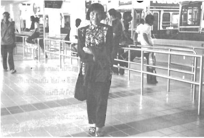
สถานีรถไฟฟ้าใต้ดิน ส่วนที่อยู่บนภาคพื้นดิน

การจะขึ้นรถไฟฟ้าใต้ดิน (Ride The MRT) ต้องขึ้น ลง ตามสถานี ก่อนขึ้นก็ต้องซื้อตั๋วโดยสาร โดยซื้อจากเครื่องขายตั๋ว (Ticket Machines) ซึ่งบอกราคาและอธิบายวิธีใช้ไว้พร้อมว่าขึ้นจากสถานีไหน ลงที่ใด จะต้องจ่ายเงินเท่าไร เราเพียงแค่เตรียมเงินเหรียญเท่าราคาที่ระบุไว้ แล้วหยอดลงในช่อง พร้อมทั้งป้อนราคาให้เท่ากับราคาตั๋วที่เราต้องการ เราก็จะได้ตั๋วโดยง่าย หากเหรียญที่เราหยอดลงไปสูงกว่าจำนวนราคาตั๋วที่เรากด เงินทอนก็จะออกมาพร้อมกับตั๋ว (หยอดน้อย ตั๋วไม่ออกจะ)