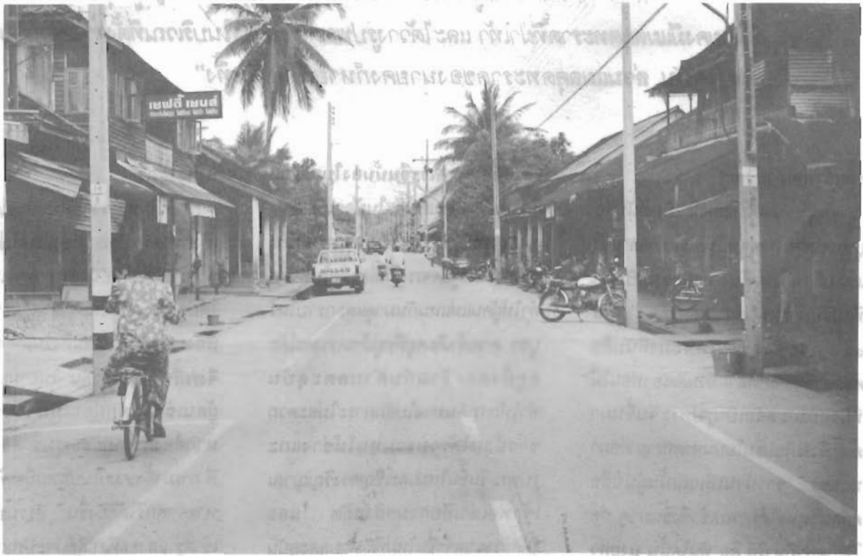
ถนนไปสู่น้ำตกหน้าผากบุรี