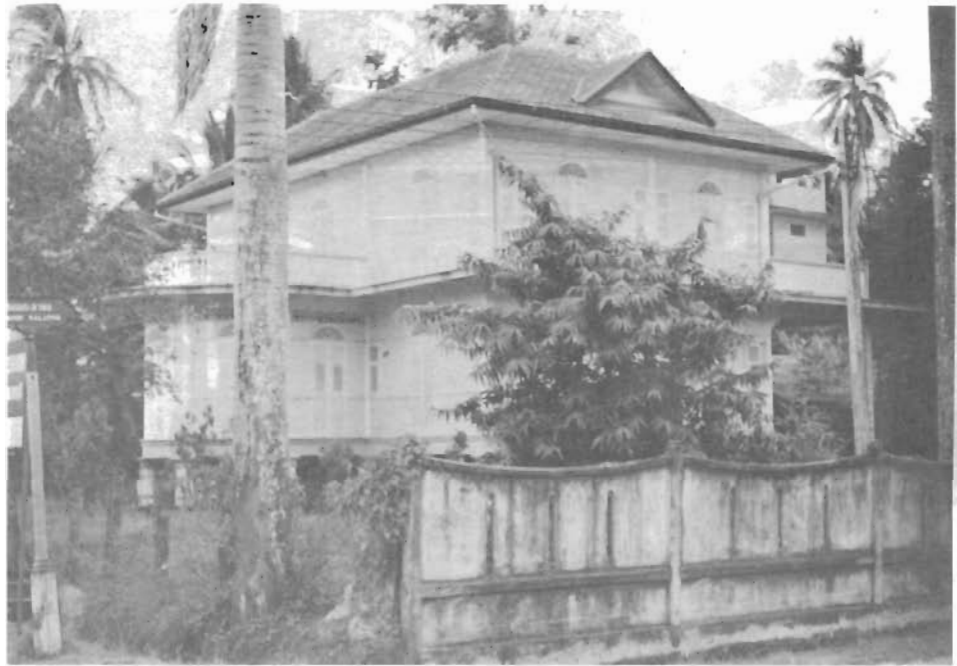
วังพระยาสุริยະสุนทรบรมภักดี (นิธิติ่ม นานแซ) เจ้าเมืองสาขบุรี สร้างในสมัยรัชกาลที่ ๕ พ.ศ. ๒๔๒๘