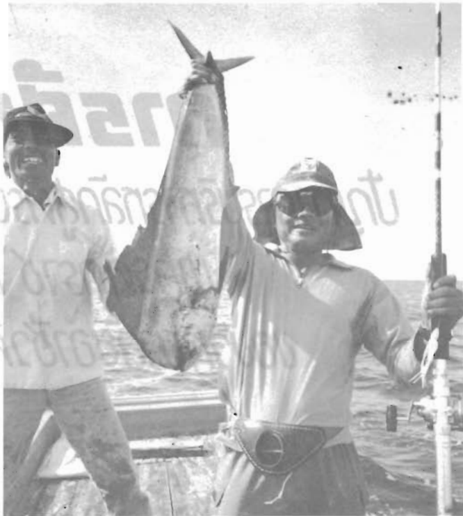
ปลาอีโต้มอญ สัญลักษณ์ของการแข่งขันกีฬาตกปลา สายบุรี

ในด้านการร่วมมือจัดการแข่งขัน กีฬาตกปลาของเทศบาลตำบลตะลุงนั้น เป็นที่น่ายกย่องว่าเจ้าหน้าที่เทศบาล ทุกท่าน พนักงานเทศบาล ข้าราชการ ประจำของอำเภอ ข้าราชการครูเทศบาล ตลอดจนราษฎรในอำเภอสายบุรี สามัคคีร่วมแรงร่วมใจกันทำงานนี้ เป็นอย่างดี เพราะชาวสายบุรีพบว่า กิจกรรมนี้เป็นวิธีหนึ่งที่จะเปิดเมืองสายบุรี ให้กว้างไกลออกไป เพราะจะมีนักกีฬา ตกปลา เพื่อนฝูง นักทัศนอาจรเข้ามา เยือนเมืองสายบุรี เป็นระยะทั้งก่อนจะ จัดงานและภายหลังจัดงาน และตลอด ไป ตั้งแต่มีการจัดการแข่งขันในครั้งแรก มาจนถึง ชาวสายบุรีได้มีโอกาสได้ต้อนรับ นักทัศนอาจรบ่อยครั้งขึ้นในช่วงวันสุด สัปดาห์ บริเวณปากแม่น้ำสายบุรีจะมี รมิดของผู้มาพักผ่อนจอต้อยู่กันเป็น แถว ผู้มาพักผ่อนส่วนใหญ่เป็นผู้ที่ นิยมออกไปตกปลานานทะเล ส่วนบริเวณ สะพานที่สร้างใหม่เชื่อมไปยังหาด วาสกรีนั้น มีนักตกปลาชายฝั่งของท้องถิ่น