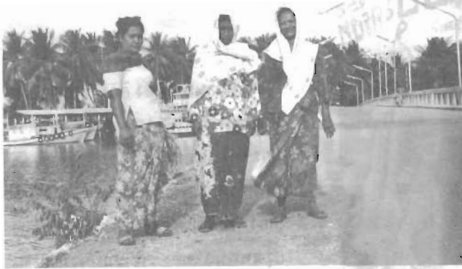
ชาวบ้านพื้นเมือง อำเภอสาขามบุรี

“ในยามค่ำคืนหาดวาสุกรีกลับมีแสงแวบแวมอยู่กลางท้องทะเลท่ามกลางความมืดนั่นคือแสงไฟจากเรือหาปลาร้อยล่ายู่ในกลางทะเล การเฝ้าดูดวงไฟเหล่านั้นเคลื่อนที่และการก่อกองไฟนั่งล้อมวงสนทนากัน นับเป็นความประทับใจยากที่จะลืม”