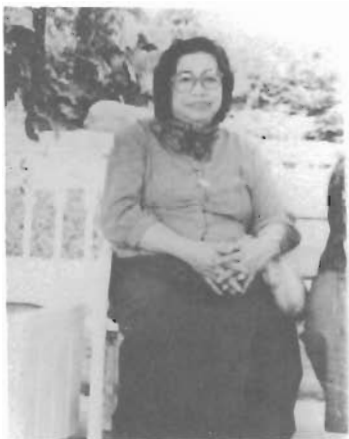
สวาท พิพิธภักดี

“สายบุรีจึงได้ชื่อว่ามี “บุญ” อร่อยที่สุดเพราะหมักด้วยปลาไส้ตันสด ๆ เพื่อให้ได้ชื่อว่ามีมาถึงเมืองสายบุรี ท่านก็ไม่ควรพลาดที่จะหาซื้อกะปิ ข้าวเกรียบ และบุญ ไปฝากญาติมิตร เพราะหากมาสายบุรีแล้วยังไม่ได้ชิมบุญที่นี่ก็เหมือนกับยังมาไม่ถึงสายบุรี”