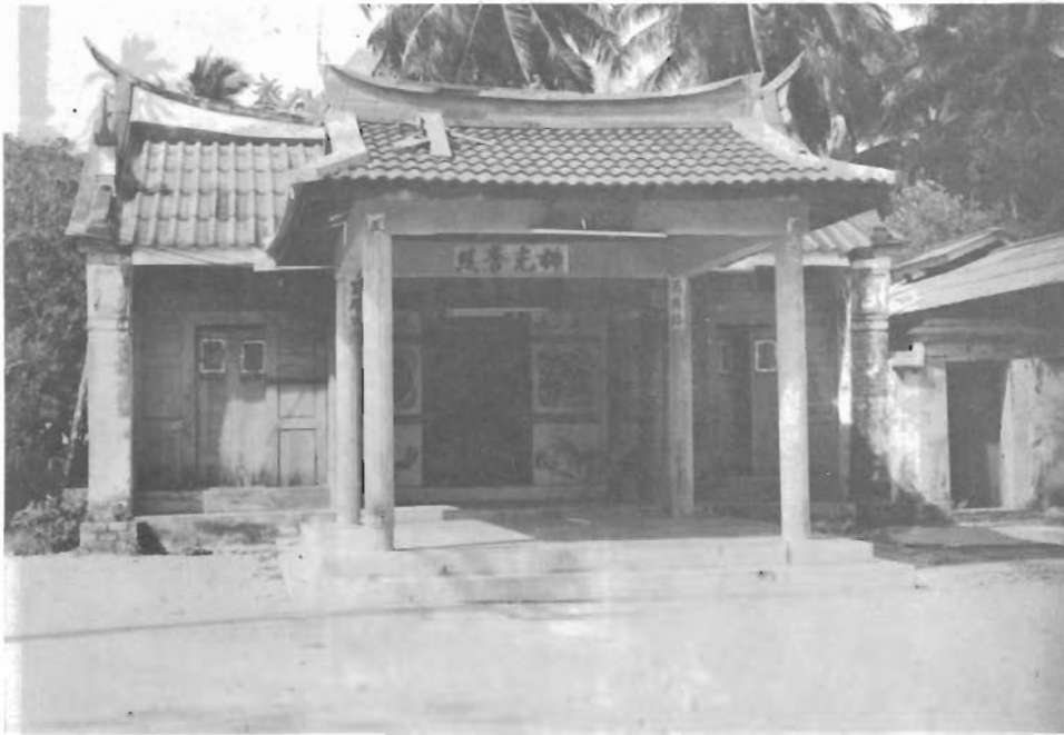
ศาลเจ้าพ่อบางตะโล๊ะ

“นายกคงได้ลืมหักอกครูปพระจีนไว้แน่น พาวังไปบนกอหญ้าลูกกลมอันแหลมคมทั้ง ๆ ที่นายกคงมีแผลคุดทะราดที่ฝ่าเท้า และได้วางรูปพระจีนนั้นลงในบริเวณที่ตั้งศาลเจ้าบางตะโล๊ะ ในปัจจุบัน ส่วนแผลคุดทะราดของนายกคงก็หายเป็นปลิดทิ้ง”