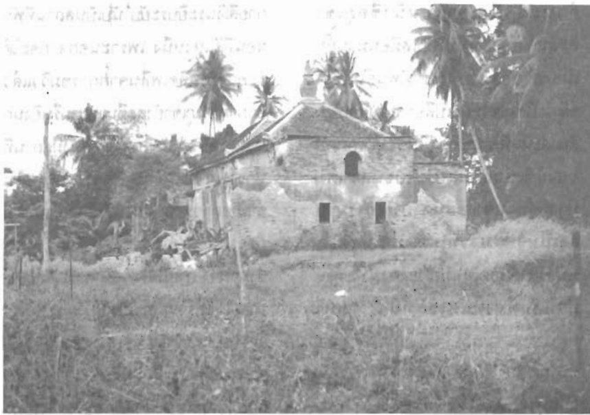
มัสยิดร้าง และสุสานเก่า ใกล้สำนักงานเทศบาลตำบลตะลุง