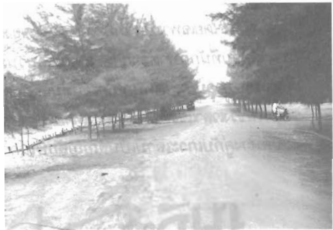
บริเวณชายหาดวาสุกรี

ผิวน้ำเป็นประกายระยิบระยับท่ามกลางคลื่นลมและไอแดด ในยามค่ำคืนหาดวาสุกรีกลับมีแสงแวบแวมอยู่กลางท้องทะเลท่ามกลางความมืดนั่นคือแสงไฟจากเรือหาปลาที่ร้อยล่ายู่ในกลางทะเล การเฝ้าดูดวงไฟเหล่านั้นเคลื่อนที่และการก่อกองไฟนั่งล้อมวงสนทนากัน นับเป็นความประทับใจยากที่จะลืม