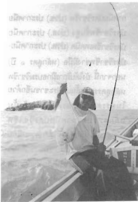
เกาะเลาปีกับปลาโฮมงาม

ยิ่งนัก จากปากร่องจนถึงบริเวณที่หา เหยื่อสำหรับตกปลานั้น ใช้เวลา ๑ ชั่วโมง หลังจากได้เหยื่อลูกปลาหลังเขียวที่ ไปรดปรานของปลาอินทรี แล้วนักกีฬา เหล่านั้นอาจจะวิ่งเรือสู่เกาะเลาปีไม่เกิน ครึ่งชั่วโมง และต่อจากนั้นนักตกปลาก็ จะพบเกมกีฬาปลาอย่างสมบูรณ์แบบ เกือบทั้งวัน จนกระทั่งถึงตอนเย็นก็เดินทาง กลับเข้าฝั่งหาดวาสกรี ทำการซั่ งปลาคิดคะแนน สรุปผลการจัดการแข่งขัน กีฬาตกปลาที่สายบุรีเป็นกองการวาม ของนักกีฬาตกปลา เขียนมาถึงตรงนี้ก็ ใคร่อยากเชิญชวนนักตกปลาและท่าน ผู้สนใจให้ไปแวะเยือนเมืองสายบุรีดู บ้าง ดินแดนบุดูอ้อยแห่งนี้กำลังรอท่าน ให้ไปพิสูจน์ว่าเป็นดังที่เล่ามาหรือไม่