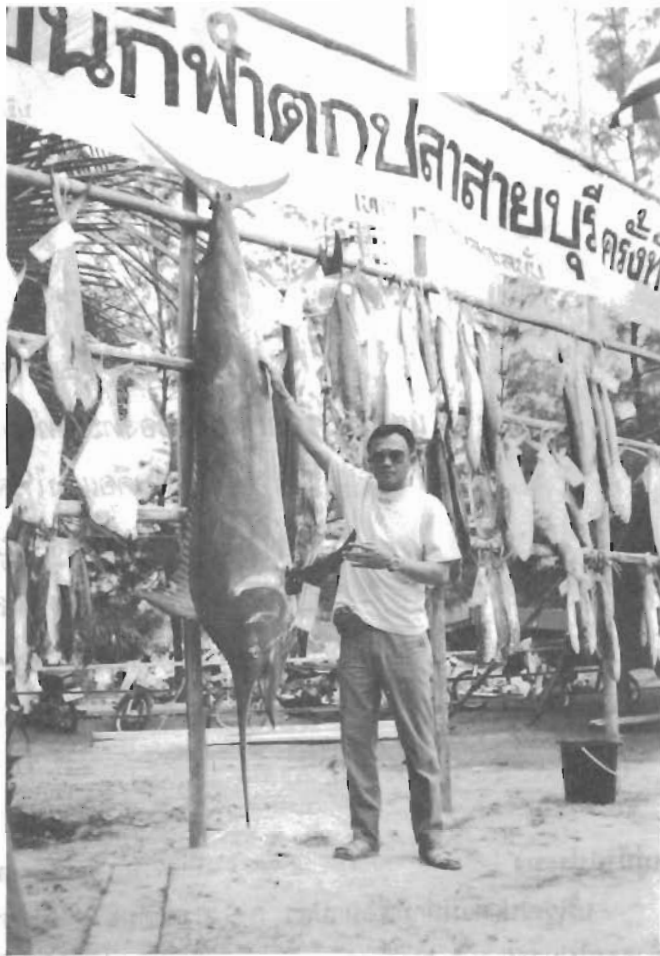
ปลากระโทงแทงขนาดใหญ่

“โดยเฉพาะปลาเกมที่เป็นจุดเด่นของสายบุรี คือ ปลาอีโต้มอญ และปลากระโทงแทง มีขนาดตามที่นักกีฬาต้องการ และมีจำนวนมากเรียกได้ว่าใครมาตกปลาที่สายบุรีในช่วงเดือนพฤษภาคม จะได้พบกับเกมอีโต้มอญ และกระโทงแทงแน่นอน และปลาชนิดนี้จะมีอยู่ชุกชุมในช่วงเวลาแข่งขัน จนกระทั่งเทศบาลตำบลตะลุงบันหรือผู้จัดได้ใช้รูปปลาอีโต้มอญกระโดดสะบัดหางคู่กับเกาะเล่าปีเป็นสัญลักษณ์การแข่งขันกีฬาตกปลาของสายบุรี”