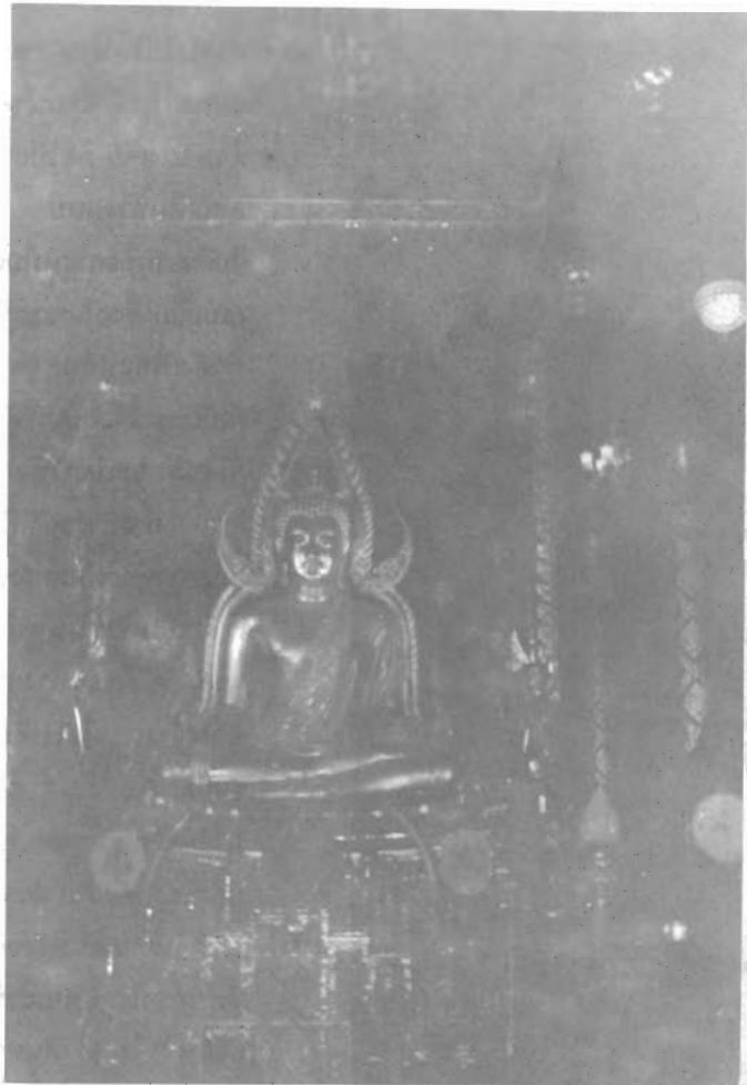
พระพุทธรชินราช พิษณุโลก

เราถึงวัดพระศรีรัตนมหาธาตุ พิษณุโลก เมื่อแสงแดดลาลู่สุดท้ายเกือบจะลับขอบฟ้าทีเดียว แต่คงจะเป็นด้วยความศรัทธาและเลื่อมใสในพุทธศาสนาอย่างแท้จริง ทำให้พุทธศาสนิกชนอย่างเราจึงมีโอกาสเข้าไปกราบนมัสการ พระพุทธชินราช ภายในพระอุโบสถได้ ทั้ง ๆ ที่จริง ๆ แล้ว พระอุโบสถจะปิดในราว ๕ โมงเย็น พระพุทธชินราชเป็นพระพุทธรูปศิลปะสุโขทัย ปางมารวิชัย มีเรือนแก้วประดับอยู่เบื้องหลัง สีทองสุกปลั่งเด่นเป็นสง่างามจับตามากผู้พบเห็นยิ่งนัก พวกเราอ้อยอิ่งอยู่ที่วัดเป็นเวลาพอสมควร จึงออกเดินทางสู่อุทยานประวัติศาสตร์ศรีวิชัย