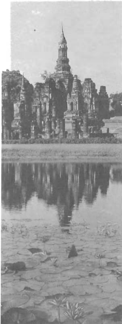
พุทธศิลป์ ๒๓๖ ศิลปะของพุทธศิลป์ ศิลปะของพุทธศิลป์ ศิลปะของพุทธศิลป์

ขึ้นก่อนใครอื่นทั่วโลก...ถ้าทายว่า อังกฤษ อเมริกา อิตาลี หรือแม้แต่ไทย แลนด์แดนสวรรค์ของเราแล้วละก็ ผิด ถนัดเลย ว่ากันว่า ชาติแรกคือจีนจะ จีนที่เคยได้รับสมญาว่าประเทศหลังบ้าน ไม่ไม่นั้นแหละ เขาเริ่มกันตั้งแต่สมัย ราชวงศ์ถังโน่น นำโดยภิกษุนามว่า “ยวนซาง” (Huan Tsang) หรือที่รู้จัก