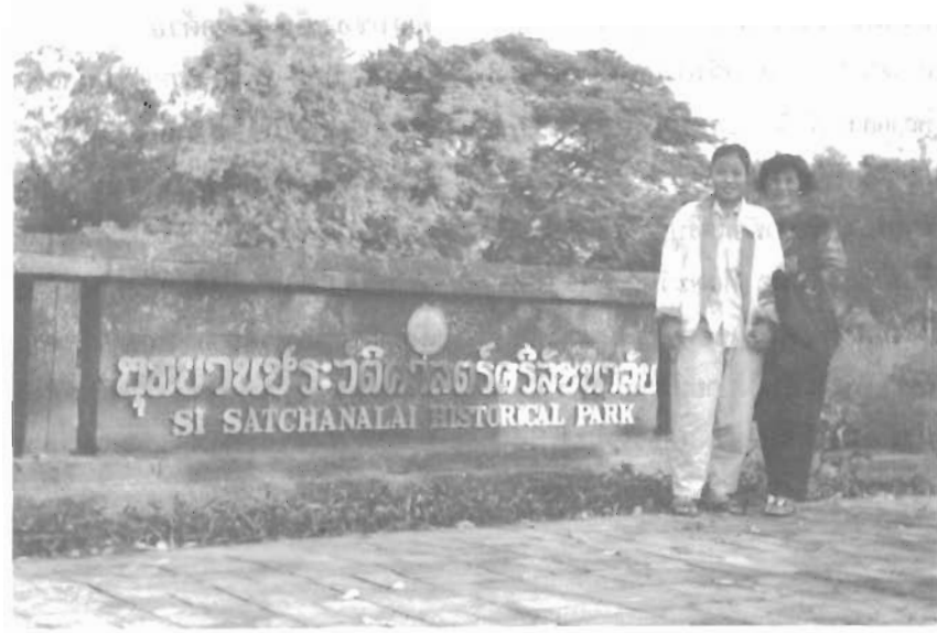
ป้ายชื่ออุทยาน

อาณานิเวศได้รับการดูแล ตกแต่งไว้อย่างสวยงามด้วยกระถางไม้ใบไม้ดอก โดยจัดวางเรียงไว้เป็นระยะ ๆ ไม้ดอกส่วนใหญ่จะเป็นเฟื่องฟ้า ซึ่งกำลังออกดอกบานสะพรั่งอวดสีแสนสดใส มีทั้งสีแดงแปดริ้ว ชมพูสด แสดเจิดจ้า โคมไฟดินเผาที่ถูกนำมาวางประดับบนหัวเสาเตี้ย ๆ รายรอบบริเวณด้านนอกนี้ด้วยเช่นกัน ทุกอย่างดูลงตัวเหมาะสมกลมกลืนไปหมด ช่างเป็นภาพที่งดงามจริง ๆ ถึงตอนนี้พี่คงต้องขอบคุณสวรรค์ (ตามสำนวนหนึ่งกำลังภายใน) แล้วละเอียง ที่ให้โอกาสที่ได้พานพบสิ่งดี ๆ เช่นนี้ พี่และพลพรรค ยืนดื่มด่ำกับความงามตรงหน้าอยู่พักใหญ่ จึงกลับเข้าไปกินอาหารเช้าเพื่อเอาแรงไว้ลุยตามโปรแกรมที่กำหนดไว้ต่อไป