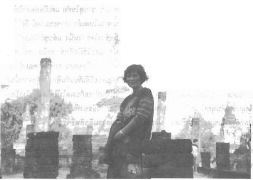
เจดีย์ทรงดอกบัวตูม ณ วัดเจดีย์เจ็ดแถว ศรีสัชชนาลัย

“ทำไมจึงมีวัดความมากมายอย่าง ที่เห็น ๆ ละคะ” เติงสมาชิกในคณะ ถามขึ้น โกด์บอกว่า บุคสมัยต่างกัน ครับ ปัจจุบัน “คนจนเล่นหวย คนรวย เล่นหุ้น นายทุนเล่นที่” แต่สมัยก่อนไม่ มีหวย ไม่มีหุ้นให้เล่น แถมที่ทางก็ไม่ต้อง ซื้อต้องขายกัน เพราะทุกคนจะได้รับพระ ราชทานตามฐานะทางสังคมของแต่ละคน ทั้งคนในสมัยก่อนจะยึดมั่น ศรัทธา และปฏิบัติตามหลักธรรมคำสั่งสอนของ พระพุทธองค์อย่างแท้จริง ดังนั้น เมื่อมี เงินทองเขาจะนำมาสร้างวัดกัน (แทนที่ จะนำไปสร้างสนามกอล์ฟ หรือคอนโดฯ ตรงนี้ที่ตัวเองนะ) วัดวาจึงมีมากมาย อย่างที่เห็น และจากสิ่งเหล่านี้มีที่ หรือที่เป็นหลักฐานแสดงให้เห็นว่าชาติ เรามีประวัติศาสตร์อันยาวนานไม่แพ้ ชาติใดเลย