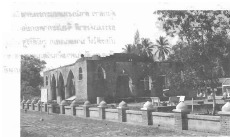
ตงกู กูติน ยะโก๊บ

ยังเป็นที่ถกเถียงและโต้ถามกัน อยู่เสมอว่า ท่านานมัสยิดกรือเซะ เจ้าแม่ ล้มกอเหนี่ยว และพี่ชายเจ้าแม่ล้มกอ เหนี่ยวชื่อว่า ล้มโต๊ะเคียม ผู้ซึ่งได้มาอยู่ที่ เมืองปัตตานี เข้ารีตนับถือศาสนา อิสลาม และได้แต่งงานกับสตรีมุสลิมนั้น แท้จริงเป็นอย่างไร และใครคือลูก หลานผู้สืบสกุลต่อมา