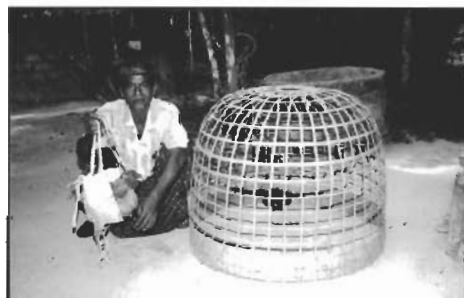
เจ้าของไก่ กับรางวัลชนะเลิศที่เคยได้รับ

สำหรับบุคคลที่สนใจการต่อสู้ของไก่ด้วยลีลาการขัน ก็ขอเชิญไปสัมผัสได้ที่สนามแข่งขันไกล่างอำเภอรามัน จังหวัดยะลา ลานวัฒนธรรมของชุมชนที่หาดูได้ที่ยะลาเท่านั้น ผู้ที่สนใจสามารถติดต่อหาข้อมูลได้ที่ องค์การบริหารส่วนตำบลตะโล๊ะพะลอ อำเภอรามัน จังหวัดยะลา ก่อนจากกันผู้เขียนอยากจะถามว่า ท่านได้ยินเสียงไก่ขันครั้งสุดท้ายเมื่อไร? สวัสดีครับ