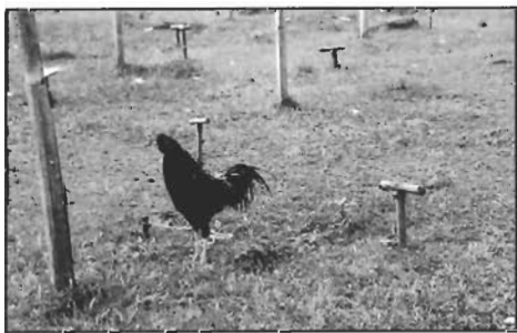
“ควน” ที่ให้ไก่ยืนเวลาแข่งขัน

ระยะเวลากว่า 50 ปี มาแล้ว ความเชื่อและความนิยมในการเลี้ยงไก่เพื่อความเป็นสิริมงคลของชุมชนชาวรามันได้เลือนหายไป ทั้งนี้ก็เพราะคนในชุมชนได้รับเอาวัฒนธรรมของสังคมเมืองเข้ามา ทำให้วิถีชีวิตของชุมชนแบบดั้งเดิมมีการเปลี่ยนแปลงไป ทั้งในด้านการประกอบอาชีพ และการใช้เครื่องอุปโภคและบริโภค เมื่อพฤติกรรมทางสังคมของคนในชุมชนได้เปลี่ยนไป การเลี้ยงไก่เพื่อใช้เสียงในการปกป้องรักษาชุมชนก็ค่อยๆ เสื่อมความนิยมไปในที่สุด