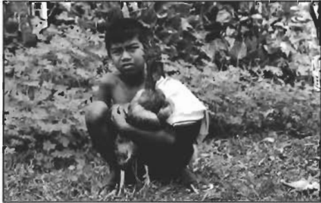
เด็ก เจ้าของไก่ก่อนนำเข้าสู่สนามแข่งขัน