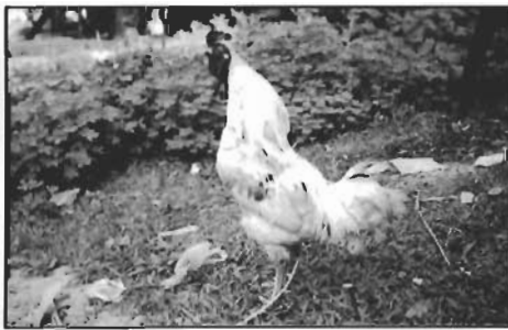
ไก่พันธุ์ลาบ

เมื่อพูดถึง “สนาม” หลายๆ ท่านก็คงจะนึกถึงสนามแข่งขันกีฬาประเภทต่างๆ ซึ่งมีทั้งสนามกีฬาพื้นบ้าน เช่น สนามวู้ชชน สนามไก่ชน สนามชนควาย หรือสนามกีฬาที่เป็นสากลโดยทั่วไป เช่น สนามฟุตบอล สนามมวย เป็นต้น แต่ถ้าพูดถึงสนามแข่งขันเสียงไก่ ท่านผู้อ่านคงจะนึกสงสัย ว่าทำไมจึงมีสนามแข่งขันเสียงไก่ จะเหมือนหรือต่างจากการแข่งขันนกเขาชวาเสียงอย่างไร ผู้เขียนเองก็รู้สึกแปลกใจไม่น้อยและเมื่อไปเจอสนามแข่งขันเสียงไก่ จึงนำมาเล่าสู่กันฟังในรัฐสมิแลฉบับนี้