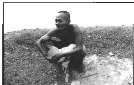
เจ้าของกับไก่ก่อนนำเข้าสูสนามแข่งขัน

รูปแบบและกติกาในการแข่งขันไก่เสียงเป็นข้อตกลงที่กำหนดขึ้นง่ายๆ โดยชาวบ้าน การแข่งขันจัดขึ้นในเวลากลางคืน โดยกำหนดให้ลานว่างของหมู่บ้านเป็นสนามแข่งขัน การแข่งขันไก่เสียงในเวลากลางคืนก็เพราะง่ายต่อการควบคุมไก่ให้ยืนอยู่กับที่ เพราะในเวลากลางคืนไก่จะมองอะไรไม่เห็น เข้ากับทำนองสำนวนไทยที่ว่า “ตาบอดไก่” เมื่อถึงสนามแข่งขันเจ้าของไก่ที่สมัครเข้าแข่งขันก็จะนำไก่ให้ยืนอยู่บน “ควน” (ที่ยืนของไก่) ที่จัดเตรียมไว้ในสนาม การตัดสินแพ้ชนะของไก่ กรรมการจะดูที่จำนวนการขันของไก่ในแต่ละยก คือกำหนดไว้ 2 ยก ยกละ 5 - 10 นาที ในแต่ละยก ไก่ตัวใดขันจำนวนเท่าไร จะมีกรรมการคอยจดแต้มให้คะแนน ในยกที่สองจะลดจำนวนเวลาลงเหลือประมาณไม่เกิน 5 นาที การให้คะแนนก็ยังคงมีกรรมการคอยนับจำนวนการขันเช่นเดิม ผลการแข่งขันจะตัดสินจากจำนวนครั้งที่ขันของไก่ ไก่ตัวใดขันมากที่สุดก็จะเป็นฝ่ายชนะ สำหรับกรณีที่ม่คะแนนเท่ากันกรรมการก็จะกำหนดให้นำไก่ที่มีคะแนนเท่ากันมาแข่งขันกันอีก 1 ยก ใช้เวลาประมาณ 3 - 5 นาที และถ้ายังมีคะแนนเท่ากันอีก ก็จำนวนการขันเท่ากัน กรรมการก็จะใช้วิธีการให้คะแนนจากเสียงขันของไก่ คือไก่ตัวไหนมีเสียงขันยาวกว่าตัวอื่นๆ ไก่ตัวนั้นก็จะเป็นฝ่ายชนะ และจากการไปสังเกตการณ์ของผู้เขียน ผู้ที่เข้าร่วมแข่งขันยังได้ให้ข้อมูลเพิ่มเติมว่าโดยปกติเวลาแข่งขันไก่จะแพ้ทางกัน ถ้าไก่ตัวใดขันเสียงดี จะมีผลทำให้ไก่ตัวอื่นๆ ไม่กล้าไถ่เสียงขัน การขันในยกแรกนั้นเป็นการลองเชิงหรือลองกำลังเสียงของไก่ แต่ตัวไก่ที่ร่วมแข่งขันถ้ารู้ว่าเสียง