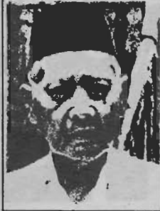
ตำแหน่งทางการเมืองที่บันทึกไว้ ได้แก่ ตำแหน่งกรมท.กระทรวงศึกษาธิการ สมัยจอมพล. ปิบูลสงคราม รมต.ช่วยว่ากระทรวงสาธารณสุข สมัยนายพจน์ สารสิน สมัยพลเอกถนอม กิตติขจร เป็นกรรมการอิสลามประจำจังหวัดสตูล และกรรมการอิสลามแห่งประเทศไทยมาตั้งแต่ปี พ.ศ. (2491)