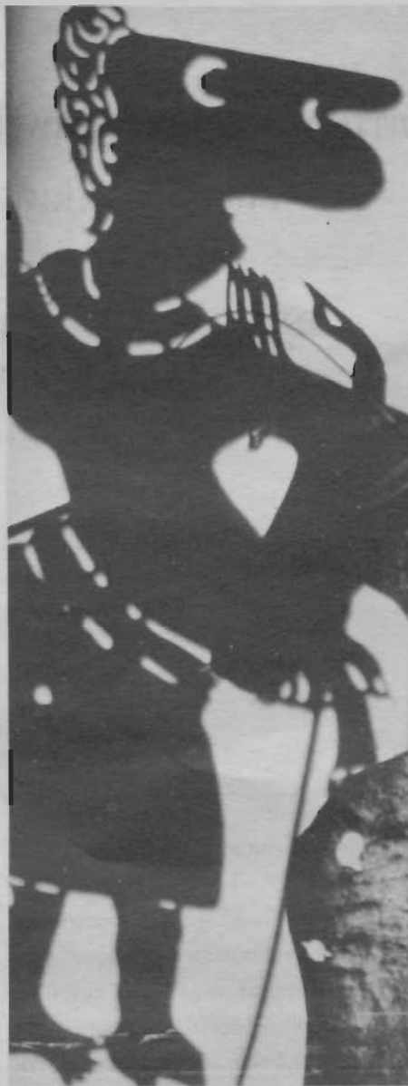
อยุธยาไม่อื่นคนคิดมันโค คนสี่จังหวัดภาคใต้ก็ไม่มีต้นคนคิดมันนั้น แลได้ เห็นว่าสมมือนี้ควรดำเนินนโยบายอย่างไร

เจ๊ะ๑ ก็ตามที่ผมบอกไว้แล้ว ถือหลักง่าย ๆ ว่าเป็นบางสิ่งบางอย่างที่เป็นยาหอมของชาวไทยพุทธอาจเป็นยาพิษของชาวไทยมุสลิมก็ได้ แลได้ มีความเห็นอย่างไรเกี่ยวกับนโยบายการปฏิรูประบบการบริหารจังหวัดชายแดนใหม่ ที่กำลังดำเนินอยู่ขณะนี้