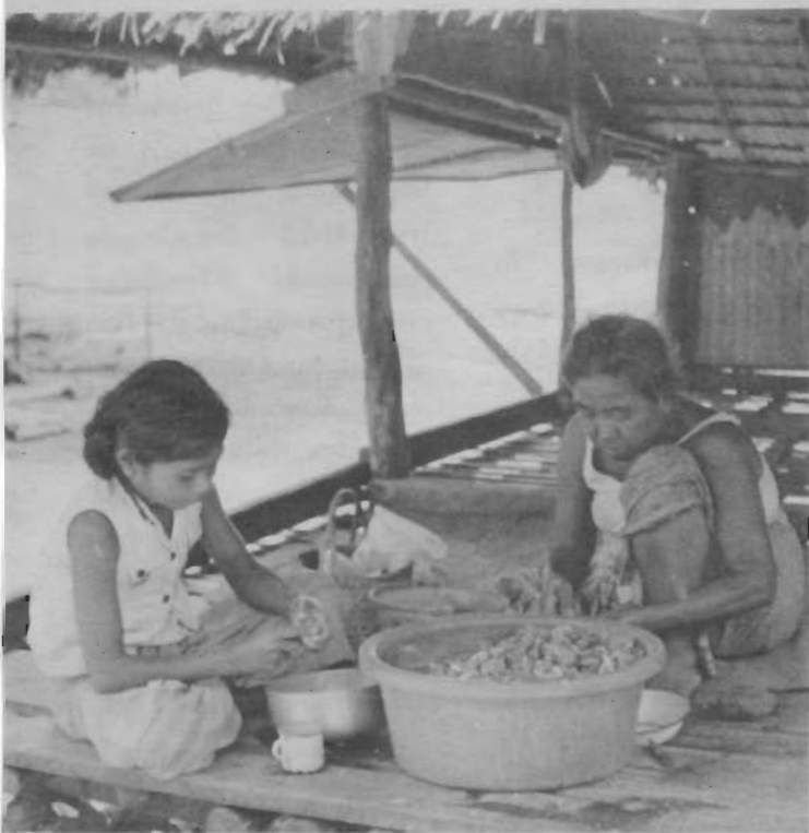
งานประจำของหญิงชาวเลส่วนใหญ่คืองานแกะหอยต้ม