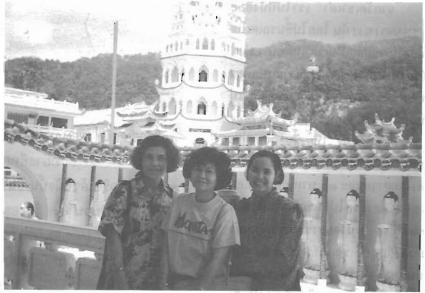
เจดีย์วัดเขาเต่า

วันนี้แม่เคิพพาขาคณะไปกินอาหารกันที่ตลาดสด โอ้ตัม แม่เคิให้เหตุผลว่า "มีของให้เลือกหลายอย่างและราคาถูกด้วย" ที่ตลาดนิตเห็นมีผักหลายอย่างมีผลไม้อ รวมทั้งอาหารสด ๆ จากทะเลสดน่าซื้อจริง ๆ ดอกไม้สดสีฉูดฉาดก็มีผู้คนส่วนใหญ่เป็นคนจีนอาหารก็มีหลายอย่าง นิตติดใจน้ำเต้าหู้ และเต้าฮวย