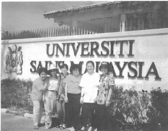
มหาวิทยาลัยซายส์ มาเลย์เซีย

“การไปเที่ยวทำให้หูตากร้างขวาง แล้วยังทำให้เป็นคนใจกว้างขึ้นอีกด้วย ไม่มอง ไม่คิด ไม่เห็นอะไรแคบ ๆ อยู่ในแวดวงใกล้ตัวเท่านั้น”