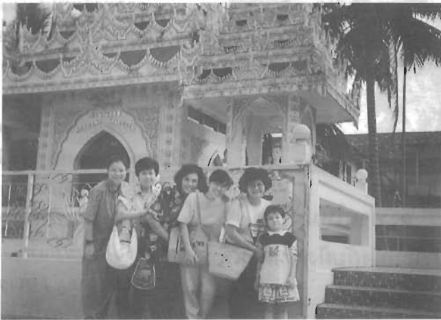
สถาปัตยกรรม ภายในวัดพม่า

เสร็จศึกพม่าแล้วพระองค์ทรงยกทัพลงมาทางใต้ เพื่อปราบหัวเมืองต่าง ๆ ที่แข็งเมือง ซึ่งรวมทั้งเมืองไทรบุรีด้วย พระยาไทรรา ซึ่งปกครองเมืองไทรรา ทราบข่าวเรื่องกองทัพไทย ก็เกิดความกลัว จึงไปขอฟังอังกฤษ ซึ่งขณะนั้นอังกฤษได้เข้ามามีบทบาททางการค้า อยู่ในแถบช่องแคบมะละกกาแล้ว และกำลังมองเกาะหมากตาเป็นมันเพื่อใช้