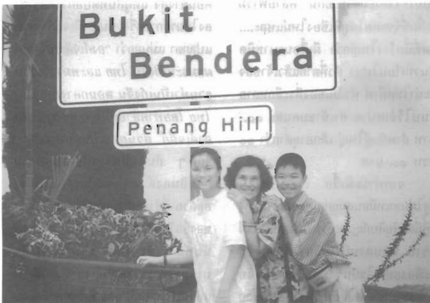
ปีนังฮิลล์

หลังจากเราไปซื้อปิ้งกัน ปัจจุบันปีนังมีห้างสรรพสินค้าหลายแห่งเราไปกันที่ห้างคอมต้าตั้งอยู่ถนนปีนัง “คอมต้า” (KOMTAR) นอกจากเป็นชื่อห้างสรรพสินค้าแล้ว ยังเป็นชื่อตึกที่สูงที่สุดในปีนังขณะนี้อีกด้วย นิดชอบบันไดทางขึ้น-ลง เขาทำเป็นขั้น ๆ มีกระถางดอกไม้ประดับเหมือนบันไดสเปนที่นิดเคยเห็นในภาพ ต่างกันที่ดอกไม้ที่นี่สวยน้อยกว่าเท่านั้น ตึกนี้สูงถึง ๖๕ ชั้น แม่บอกว่า “ชั้นสูง ๆ ใช้เป็นสำนักงานเกี่ยวกับการท่องเที่ยวของที่นี่ ส่วนชั้นบนสุดเป็นที่ชมวิว ปัจจุบันมีหลายคนที่ไปปีนังแล้วขึ้นไปชมวิว และสูดอากาศบริสุทธิ์บนตึกนี้แทนการขึ้นปีนังฮิลล์” ส่วนชั้นล่าง ๆ ๔-๕ ชั้น นิด