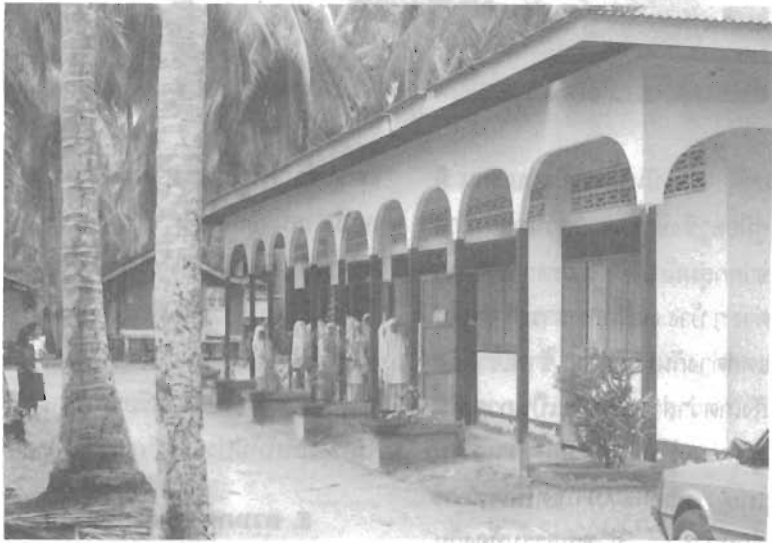
ภาพที่ 1 อาคารโรงเรียน...

ขณะที่นักเรียนไทยมุสลิมจะขาด ภูมิหลังในเรื่องเหล่านี้ต่างจากกลุ่ม นักเรียนทั่วไป ตัวอย่างเช่น เนื้อหา แบบเรียนทักษะสัมพันธ์ชั้นมัธยม ศึกษาตอนต้นบางเรื่อง ได้แก่ “ความ สนุกในวัดเบญจมบพิตร (ม. 1)” “ข้อคิดจากการบวช (ม. 2)” “ขวัญ และคำเรียกขวัญแบบเมืองเหนือ (ม. 3)” หรือในชั้นมัธยมศึกษาตอน ปลาย เช่น “ผลพลอยได้จากการ ออกพรรษา (ม.4)” “พระครูวัด ฉลอง ม. 4)” “มงคลสูตรคำฉันท์ (ม. 6)” “วรรณกา กาลมสูตร (ม. 6)” “มหาเวสสันดรชาดก (ม. 5, ม. 6)” เป็นต้น การสอนวรรณคดี ไทยแก่นักเรียนไทยมุสลิม จึงต้อง อาศัยการสอนในเชิงเปรียบเทียบ วัฒนธรรมของชาวไทยพุทธกับชาว ไทยมุสลิมด้วย มิใช่มุ่งแต่อธิบาย ศัพท์เพียงอย่างเดียว ซึ่งไม่เกิดประ- โยชน์เท่าที่ควร เพราะเขาจะลืมได้ ง่ายเนื่องจากไม่มีโอกาสใช้ศัพท์ ยาก ๆ เหล่านั้น สิ่งที่ครูควรจะสื่อ ก็คือ แนวคิด ค่านิยม ความเชื่อ ประเพณีต่าง ๆ ให้เขาได้เข้าใจ นอกเหนือจากเนื้อเรื่องหรือคำอธิบาย ศัพท์ บางครั้งนักเรียนอาจ อธิบายได้ต่อไปอีก เช่น การสอน เรื่องเสภาขุนช้างขุนแผน ในชั้น มัธยมศึกษาปีที่ 3 ตอนพลายแก้ว คู่ขนานนางพิมพิลาไลย จะกล่าวถึง การปลุกบ้านหรือเรือนหอแบบโบ- ราณ ถ้าครูชี้แนะ นักเรียนอาจจะ เปรียบเทียบได้กับการปลุกบ้านของ ชาวไทยมุสลิม การเคลื่อนย้ายบ้าน ทั้งหลังโดยไม่ต้องรื้อเหมือนบ้านไทย