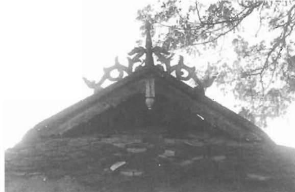
ยอดจั่วซึ่งมีเอกลักษณ์เฉพาะตัว มีรูปแบบเหมือนกับเรือนไทยมุสลิมภาคใต้