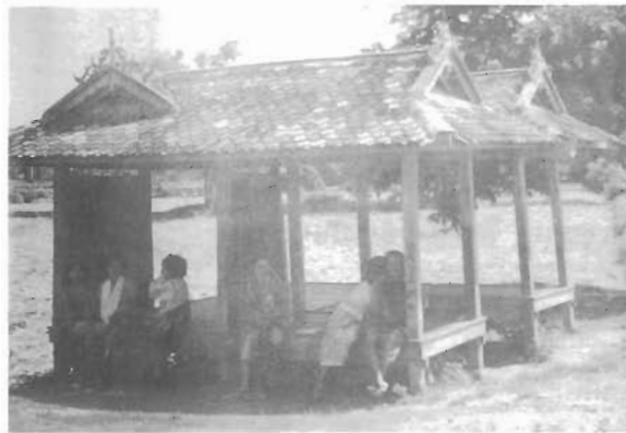
ศาลาริมทาง บ้านจาแบปะ 1 ต.ระแงง อ.ยะรัง จ.ปัตตานี ศาลาแบบนี้จะพบทั่วไปในจังหวัดภาคใต้ ที่หน้าจั่วเป็นลักษณะขนมปังขิงรุ่นหลัง (น. ณ ปากน้ำ, 2535 : 243)

ชัดเจน จากการสอบถามชาวบ้านข้างเคียงทราบว่าศาลาดังกล่าวสร้างขึ้นเพื่อประโยชน์ทางการคมนาคมของชาวบ้านมาปะและบริเวณใกล้เคียง เช่น หมู่บ้านจาแบปะหรือชาวบ้านตำบลวัด ใช้สำหรับพักคอยรถโดยสารประจำทางเข้าสู่ตัวอำเภอและจังหวัด และเป็นที่พักชั่วคราวของชาวบ้าน ก่อนเดินทางเข้าสู่หมู่บ้าน นอกจากนี้ยังใช้เป็นสถานที่พบปะสังสรรค์ในกลุ่มเพื่อนฝูง ใช้ประกอบพิธีกรรมทางศาสนาอิสลาม (ละหมาด) เนื่องจากชาวบ้านส่วนใหญ่นับถือศาสนาอิสลาม รวมทั้งใช้รับประทานอาหารในช่วงเวลากลางวันหลังจากเสร็จสิ้นภารกิจจากการประกอบอาชีพเกษตรกรรม เช่น ทำสวน ทำนา ฯลฯ