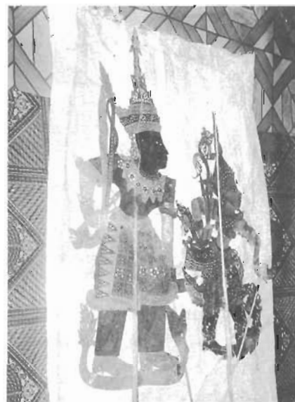
"ตัวหนัง" ที่ใช้ในการฉลองศาลา ซึ่งเป็นการแสดงหนังตะลุง เรื่อง "รามเกียรติ์"