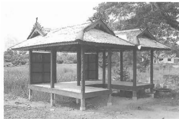
ศาลาหมู่บ้านมาปะในปัจจุบัน