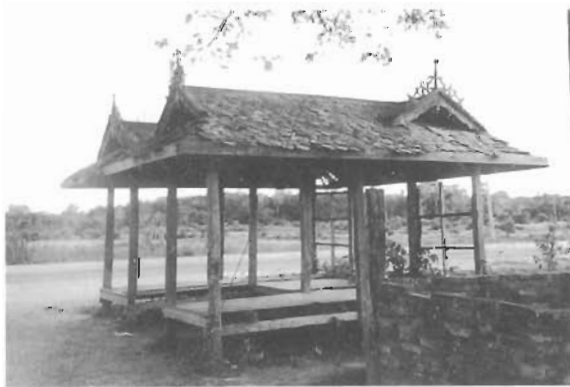
ภาพศาลา ชีตบันติกเมื่อปี พ.ศ.2539