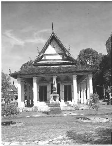
พระอุโบสถเก่า