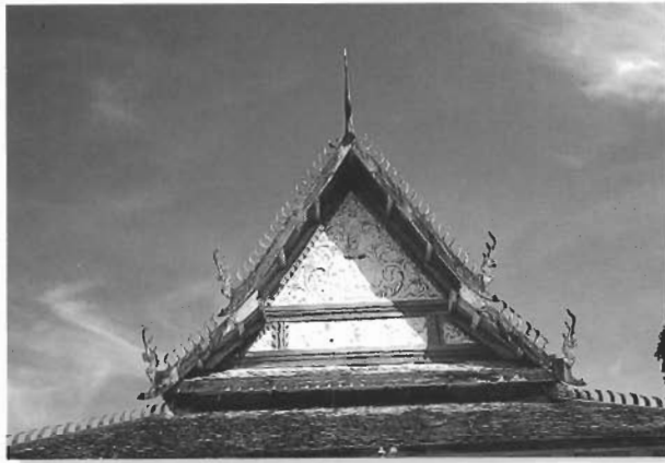
หน้าบ้านเป็นลายปูนปั้นเขียนสี