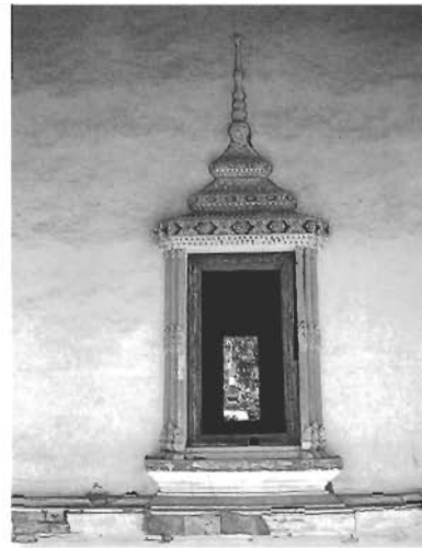
ซุ้มหน้าต่างเป็นปูนปั้นประดับกระจก มีรูปแบบเป็นทรงมณฑปยอดเจดีย์ย่อมุมไม้สิบสอง