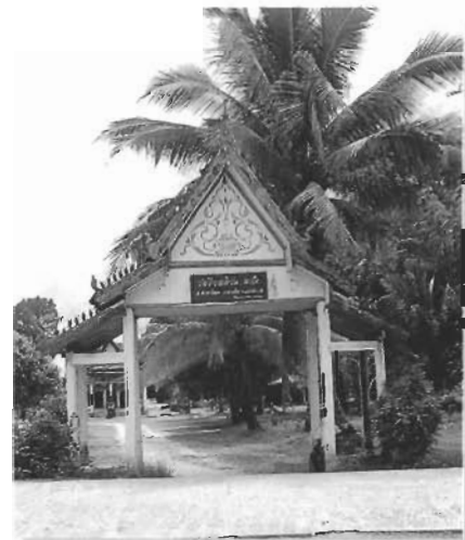
ภาพซุ้มประตูเก่า ซึ่งมีลักษณะร่วมสมัยกับอาคารและสิ่งก่อสร้างภายในวัด