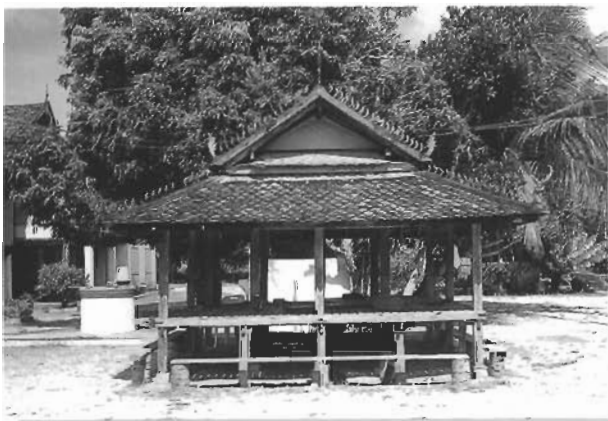
ศาลา ลักษณะอาคารเป็นเครื่องไม้มุงกระเบื้องดินเผาทั้งหลัง