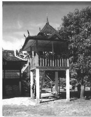
หอกลอง เป็นอาคารเครื่องไม้เสาคอนกรีต