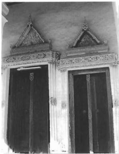
ซุ้มประตูปูนปั้นเขียนสีประดับกระจก