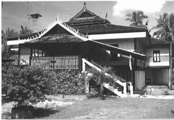
กุฎีเจ้าอาวาส เป็นอาคารคริมุข