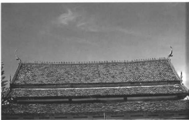
หลังคาพระอุโบสถมุงด้วยกระเบื้องดินเผา มีปราสาทลวดสลักหลังคา