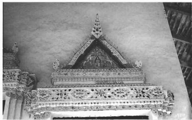
ซุ้มประตูปูนปั้นเขียนสีประดับกระจก