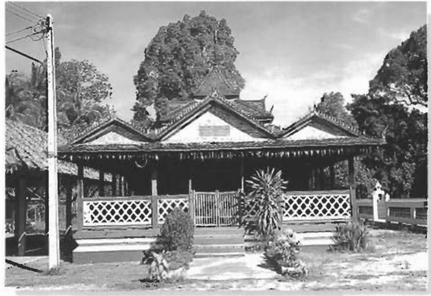
ศาลาการเปรียญ เป็นอาคารยกคมนาตปจครมุข