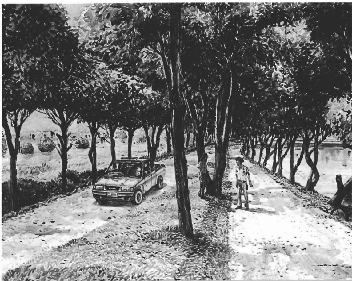
Citizen's Lung ของ หมดหนุด บุญเทียม