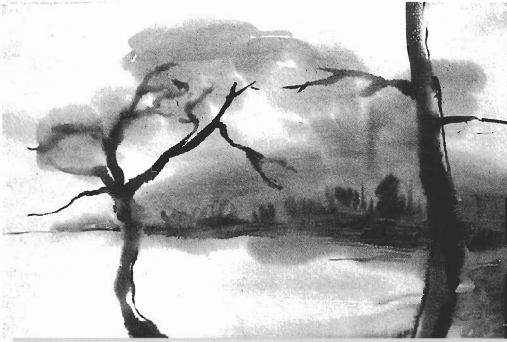
ตะวันออกไกล ของ ภิญโญ เพชรแก้ว