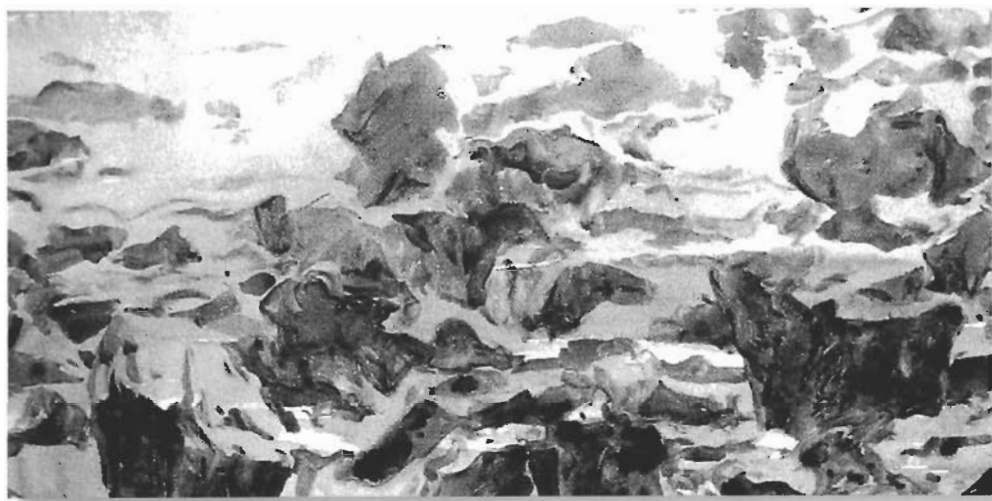
เดือนตุลาคม ของ อรรถพล ลือขจร