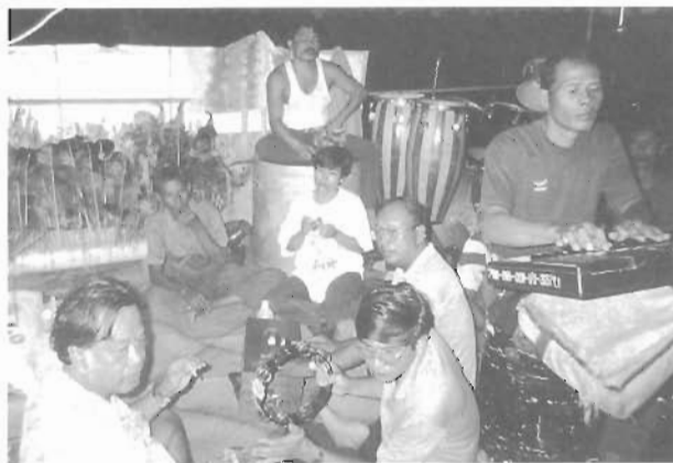
ดนตรีที่ใช้ในการแสดง ต่างได้รับอิทธิพลจากดนตรีตะวันตกเช่นกัน