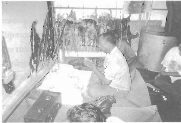
ความเชื่อทางไสยศาสตร์ยังคงปรากฏให้เห็นทั้งในหนังตะลุง และหนังประโมทัย โดยมีจุดประสงค์ที่เหมือนกันคือ เพื่อความเป็นสิริมงคลและขจัดสิ่งที่ไม่ดีออกไป