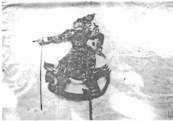
"พระลักษมณ์"