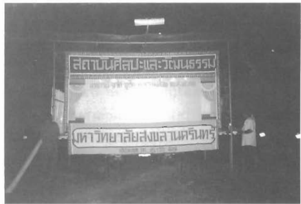
คณะหนังตะลุงของมหาวิทยาลัยสงขลานครินทร์

ส่วนบทบาทและการรับใช้สังคมก็เริ่มเปลี่ยนไปจากเดิมเช่นกัน