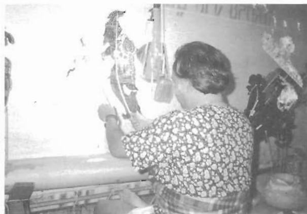
การสื่ออารมณ์และบุคลิกของตัวหนังขึ้นอยู่กับนายหนังเป็นสำคัญ

เมื่อมีการนำหนังตะลุงเข้าไปในภาคอีสานและเกิดการผสมผสานทางวัฒนธรรมระหว่างการแสดงหนังตะลุงจากทางภาคใต้และวัฒนธรรมในภาคอีสานที่มีอยู่เดิมแล้ว วัฒนธรรมที่เกิดขึ้นใหม่คือ การแสดงหนังประโมทัย จึงเกิดความแตกต่างจากวัฒนธรรมการแสดงหนังตะลุงที่มีอยู่เดิม แต่ก็ยังคงรูปแบบที่มีความคล้ายคลึงหนังตะลุงอยู่บ้าง