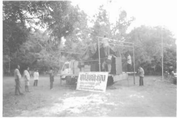
ด้วยบริบททางสังคมที่เปลี่ยนไป ปัจจัยในการแสดง เช่น โรงหนัง จึงปรับเปลี่ยนตามไปด้วย