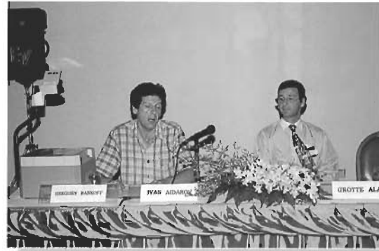
บรรยากาศการสัมมนาและการนำเสนอผลงานในกลุ่มย่อย ISSD 4