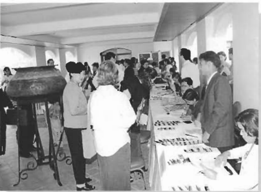
บรรยากาศการลงทะเบียน ISSD 4