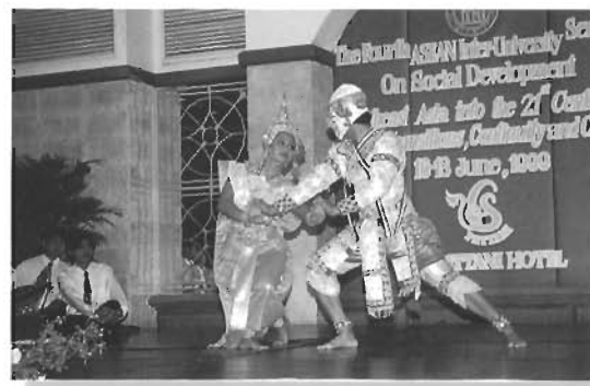
บรรยากาศงานเลี้ยงรับรองผู้เข้าร่วมสัมมนา โดยมอ. เป็นเจ้าภาพ คืนวันที่ 16 มิถุนายน 2542 และมหาวิทยาลัย แห่งชาติสิงคโปร์ (NUS) เป็นเจ้าภาพในคืนวันที่ 17 มิ.ย. 2542