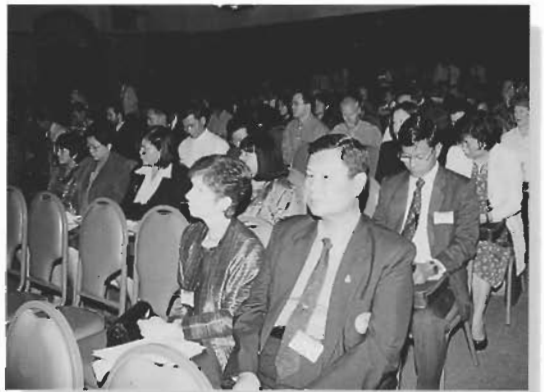
ผู้เข้าร่วมสัมมนา ISSD 4