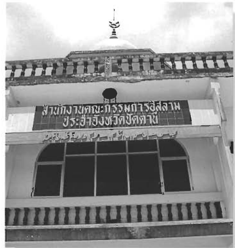
ภาพที่ 1-6 ภาพภายนอกอาคารสำนักงานคณะกรรมการอิสลามประจำจังหวัดปัตตานี ซึ่งบ่งบอกถึงลักษณะของสถาปัตยกรรมที่มีเอกลักษณ์เฉพาะและมีความงดงามในมุมมองด้านต่าง ๆ